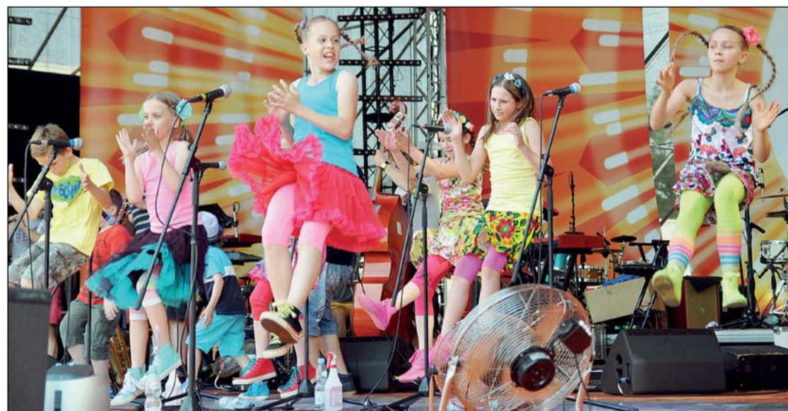
Jedną z gwiazd legionowskiego pikniku była Arka Noego

Rockowo i ambitnie zostały zaplanowane tegoroczne obchody Dni Legionowa. Gwiazdą wieczoru był znany z brawurowych interpretacji utworów Agnieszki Osieckiej zespół Raz Dwa Trzy.