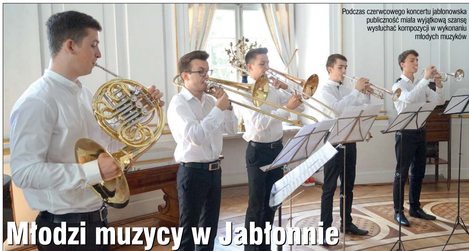
Podczas czerwcowego koncertu jabłonowska publiczność miała wyjątkową szansę wysłuchać kompozycji w wykonaniu młodych muzyków