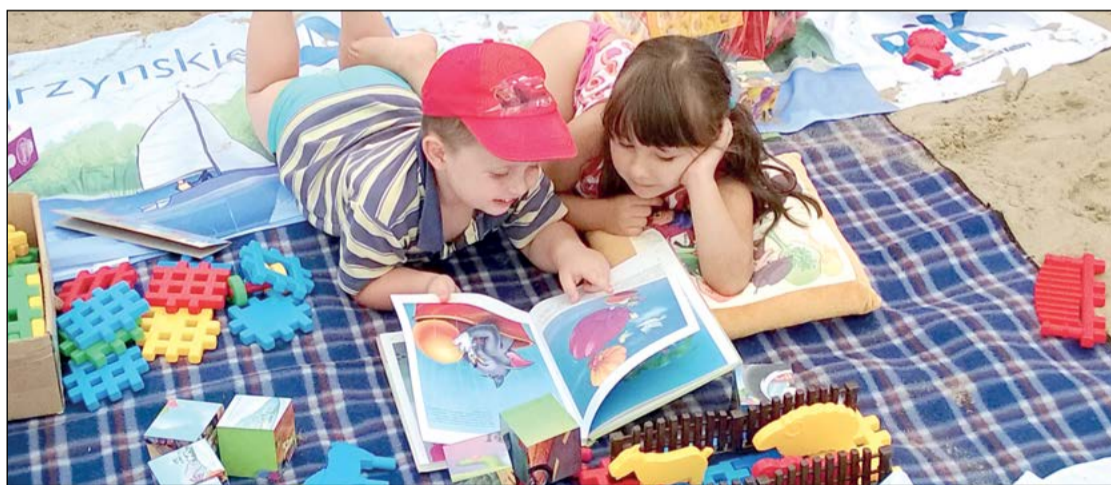
W tym roku ponownie odbędzie się akcja „Książka na plaży”, która w ubiegłym roku cieszyła się dużym powodzeniem mieszkańców i turystów

17 sierpnia w godzinach 16.30-18.00 odbędą się warsztaty plastyczne dla