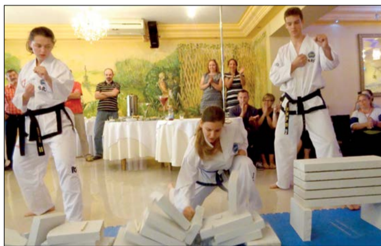
Podczas uroczystości publiczność obejrzała pokaz umiejętności zawodników trenujących taekwon-do

Ćwierćwiecze stuknęło jednemu z najbardziej utytułowanych klubów sportowych powiatu legionowskiego – LKS Lotos Jabłonna uroczystie i piknikowo obchodził swoje 25. urodziny.