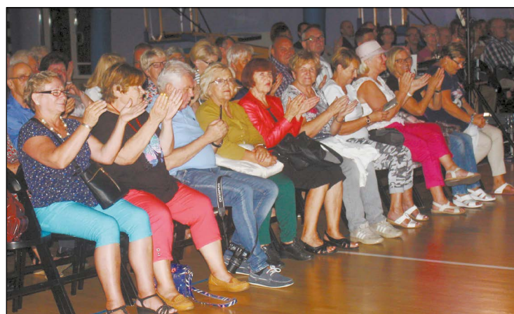
Koncert stworzył seniorom okazję do spotkania się, rozmów i wspomnień

Jestem bardzo zadowolona, że tak wiele osób przybyło na koncert. Chcieliśmy wywabić seniorów z domów i zachęcić do wspólnej zabawy. Myślę, że to udało się w stu procentach. Jako organizatorzy mieliśmy okazję porozmawiać z obecnymi. Seniorzy mówili o swoich oczekiwaniach, opowiadali o swoich radościach i bolączkach. To cenna wiedza, dzięki której możemy w przyszłości planować nasze działania tak, aby jak najlepiej odpowiadały na potrzeby seniorów.