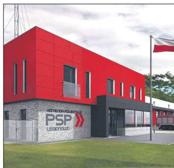
Wizualizacja nowej strażnicy Komendy Powiatowej Państwowej Straży Pożarnej w Legionowie