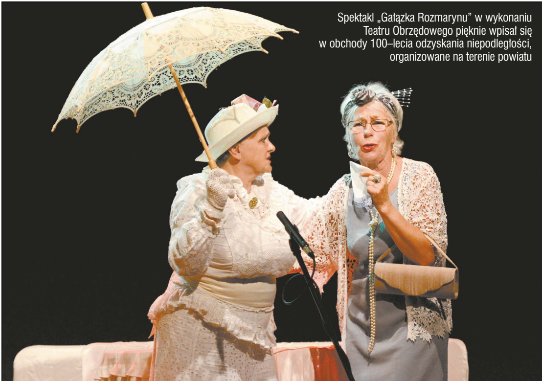
Spektakl „Gałązka Rozmarynu” w wykonaniu Teatru Obrzędowego pięknie wpisał się w obchody 100-lecia odzyskania niepodległości, organizowane na terenie powiatu

W powiecie odbywa się wiele wydarzeń społecznych, kulturalnych i sportowych organizowanych pod szyldem 100. rocznicy odzyskania niepodległości. Jednym z nich było przedstawienie teatralne „Gałązka rozmarynu” w wykonaniu nieporęckiego Teatru Obrzędowego, które zaprezentowano 8 września w Legionowie.