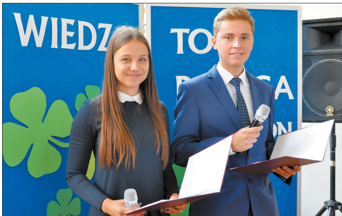
Uczniowie PZSO w Legionowie w nowy rok szkolny wchodzą z uśmiechem

Wakacje dobiegły końca. Nowy rok szkolny uczniowie i nauczyciele w całej Polsce powitali 3 września.