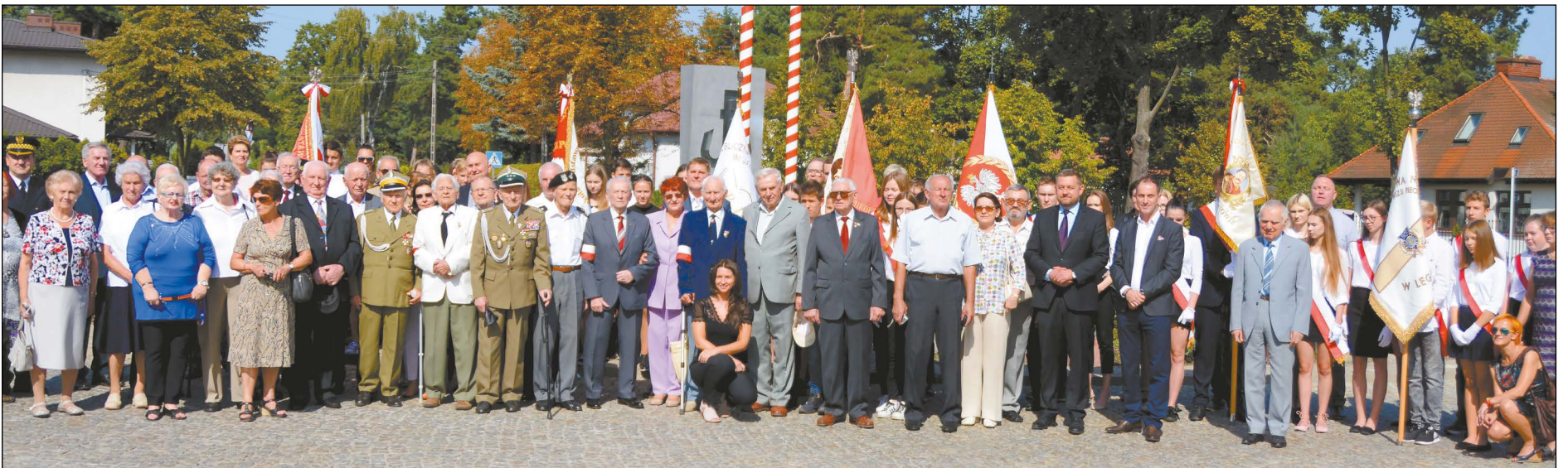
Powiat Legionowski zorganizował uroczyste obchody Dnia Weterana, w których licznie uczestniczyli przedstawiciele środowisk kombatanckich, władz samorządowych oraz zaproszeni goście

Dzień Weterana to wyjątkowe święto obchodzone w całej Polsce 1 września. W tym szczególnym dniu uczestnicy walk za wolność Polski dbają o przywrócenie pamięci o poległych oraz wychowanie młodych pokoleń w szacunku do ojczyzny.