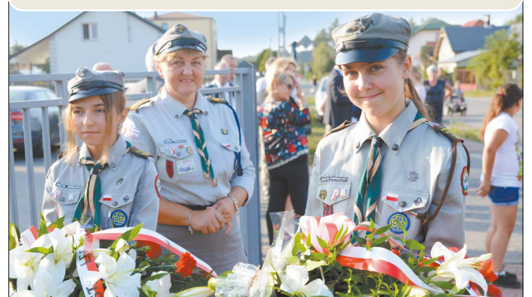
Jednym z punktów obchodów 79. rocznicy wybuchu II wojny światowej były uroczystości pod pomnikiem poległych pilotów polskiego bombowca PZL 37B „Łoś” w Wólce Radzywińskiej, w których uczestniczyli harcerze

„Naród, który nie zna swej historii skazany jest na jej powtórne przeżycie”. Dlatego też co roku na terenie powiatu organizowane są uroczystości upamiętniające najważniejsze wydarzenia z historii naszego kraju. Mieszkańcy powiatu, po raz kolejny, odrobili trudną lekcję historii i uczcili walczących za wolność wyrażając nadzieję, że zło i okrucieństwo nie powrócą już nigdy, a przyszłym pokoleniom przyjdzie żyć w pokoju i dobrobycie.