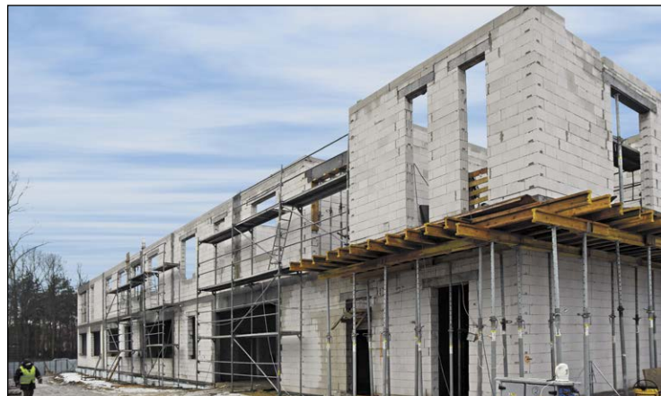
Lokalizacja nowej strażnicy w strategicznym punkcie miasta pozwoli na skrócenie czasu dojazdu do zdarzeń oraz poprawi zabezpieczenie operacyjne rejonu chronionego, a tym samym bezpieczeństwo mieszkańców na terenie powiatu

Na terenie u zbiegu ulic Jagiellońskiej, Nowobarskiej i Alei Krakowskiej w Legionowie powstaje budynek strażnicy. Prace są już mocno zaawansowane, a ich efekty widoczne coraz bardziej. Wkład Powiatu Legionowskiego w realizację tej inwestycji to milion złotych.