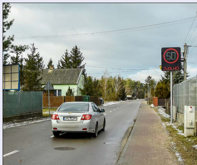
Sygnalizacja informująca o przekroczeniu dozwolonej prędkości na ul. Wolskiej poprawi bezpieczeństwo w okolicy