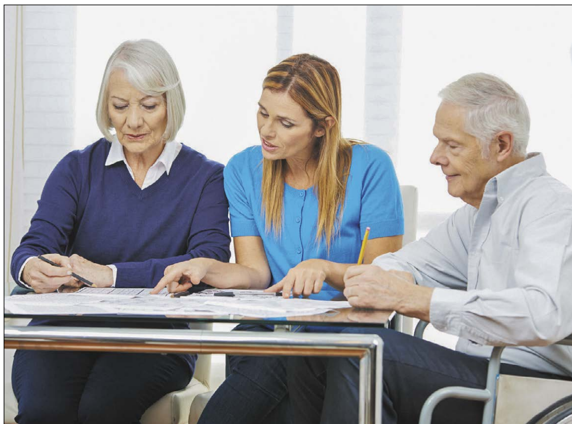
Prawnicy dyżurujący w punktach nieodpłatnej pomocy prawnej wskażą ścieżkę postępowania oraz pomogą napisać pismo do sądu lub urzędu

Starostwo Powiatowe w Legionowie Legionowo, ul. Sikorskiego 11, p. 207 pon. - pt. 16:00-20:00