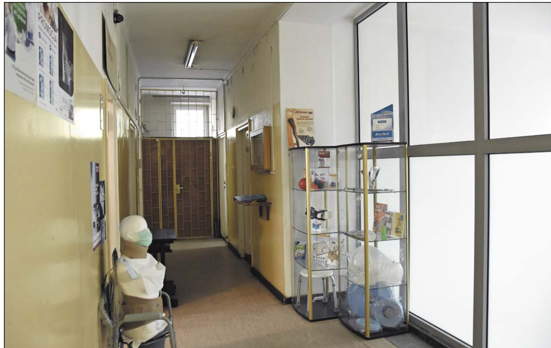
Następny etap modernizacji legionowskiej przychodni przy ul. Sowińskiego 4 to kolejny krok ku nowoczesności i poprawie funkcjonalności tego obiektu. Nadgrzyzione zębem czasu korytarze i gabinety już niedługo przestaną straszyć pacjentów

Modernizacja NZOZ „Legionowo”, aktywne przejścia dla pieszych, przebudowa i utrzymanie powiatowych dróg oraz chodników, a także kontynuacja rozbudowy Powiatowego Zespołu Szkół i Placówek Specjalnych to tylko część inwestycji, na których realizację zarezerwowano w tegorocznym budżecie Powiatu ponad 16 milionów złotych.