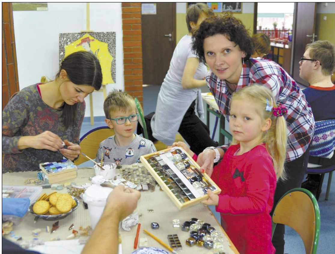
Warsztaty były okazją nie tylko do stworzenia pięknych prac, ale także pozwoliły kreatywnie spędzić czas w gronie rodzinnym

Kolorowo zrobiło się w Powiatowym Zespole Szkół i Placówek Specjalnych w Legionowie, a to za sprawą V Krajowych Warsztatów Witrażu i Mozaiki Artystycznej, które odbyły się 5 stycznia br.