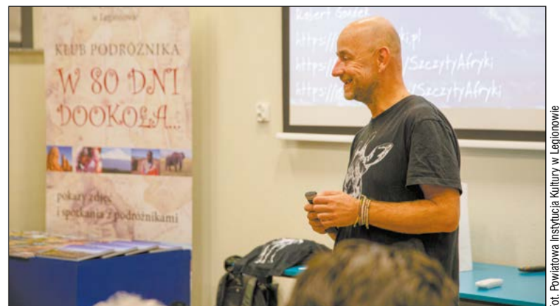
Barwna opowieść, okraszona pokazem zdjęć i pamiątek, przeniósł zebrań z jesiennego Legionowa do ciepłego Ekwadoru i na Wyspy Galapagos