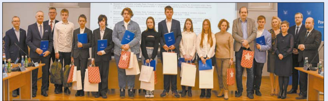
Laureaci konkursu „Legiony a niepodległość Polski w latach 1914-1918. Rola Józefa Piłsudskiego” podczas rozdania nagród

To jest konkurs o ponad 20-letniej tradycji. Dzięki niemu popularyzujemy tradycje patriotyczne związane z nurtem legionowym. Nasze Muzeum jest partnerem konkursu niemal od początku. Przygotowujemy pytania, uczestniczymy w komisji konkursowej, wraz z nauczycielami sprawdzamy odpowiedzi. Stąd wiemy, że poziom konkursu jest coraz wyższy. Serdecznie gratuluję laureatom i wszystkim jego uczestnikom.