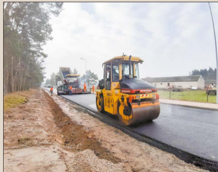
Poszerzona o utwardzone pobocza droga zyskuje nową nawierzchnię, oznakowanie oraz oświetlenie. Jeżeli pogoda będzie sprzyjająca, wykonawca planuje zakończenie rozkładania ostatniej warstwy masy do końca roku

układ torowy, trwa montaż rozjazdów. Na peronach pierwszym i drugim niebawem pojawią się wiaty przystankowe. Następnie zamontowane zostaną ławki i funkcjonalne oświetlenie. Dobrą orientację zapewnią tablice informacyjne i czytelne oznakowanie. Będą udogodnienia dla osób o ograniczonej możliwości poruszania się. Linie naprowadzające ułatwią dojście osobom niewidomym i słabowidzącym.