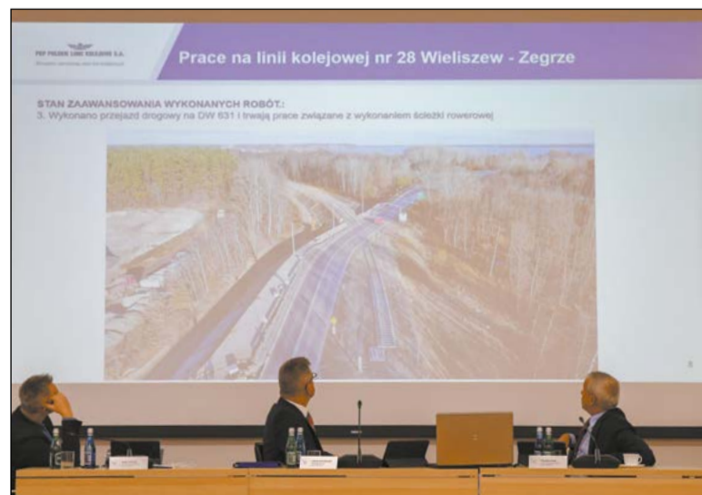
Prace związane z rewitalizacją połączenia kolejowego do Zegrza Płd. są już na ostatniej prostej. Pierwsze pociągi pojadą tą trasą wiosną przyszłego roku

Podczas listopadowej sesji powiatowi radni zapoznali się z przebiegiem i zaawansowaniem prac na dwóch ważnych inwestycjach realizowanych na terenie powiatu legionowskiego – rewitalizacji linii kolejowej nr 28 do Zegrza Południowego oraz przebudowie DK 61 na odcinku Legionowo – Zegrze Płd.