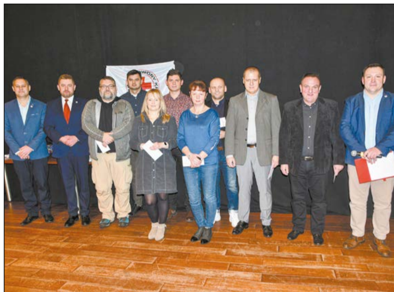
Nie ma cenniejszego daru niż dar życia. Honorowi krwiodawcy zostali odznaczeni podczas uroczystości z okazji Dni Honorowego Krwiodawstwa Polskiego Czerwonego Krzyża

Dni Honorowego Krwiodawstwa Polskiego Czerwonego Krzyża, których obchody zorganizował Oddział Rejonowy Polskiego Czerwonego Krzyża w Legionowie, były okazją do wyróżnienia najaktywniejszych krwiodawców, osób wspierających ideę honorowego krwiodawstwa i współpracujących z PCK oraz uczestników konkursów tematycznych.