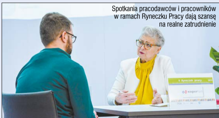
Spotkania pracodawców i pracowników w ramach Ryneczku Pracy dają szansę na realne zatrudnienie

Powiatowe Centrum Integracji Społecznej w Legionowie ma w swojej ofercie szeroki wachlarz działań, mających na celu pomoc osobom długotrwale bezrobotnym i zagrożonym wykluczeniem społecznym. Ryneczek Pracy, który w tym roku odbył się już po raz szósty, stwarza uczestnikom realną szansę na podjęcie zatrudnienia i uzyskanie niezależności życiowej. To także doskonały przykład współpracy lokalnych przedsiębiorców z samorządem powiatowym na rzecz potrzebujących.