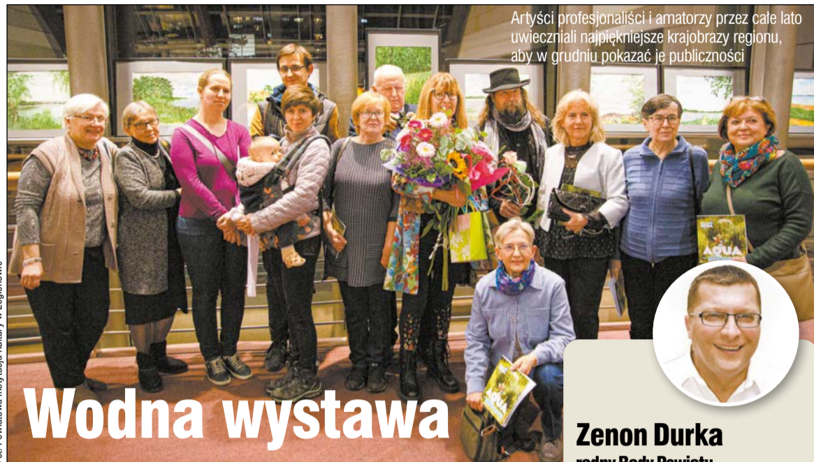
Artyści profesjonalści i amatorzy przez całe lato uwieczniali najpiękniejsze krajobrazy regionu, aby w grudniu pokazać je publiczności