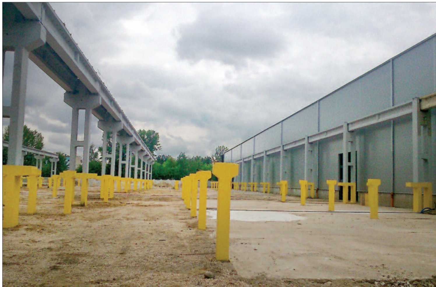
Inwestycja w trakcie budowy

W powiecie, na granicy Legionowa i Łajska powstaje nowa inwestycja, dzięki której pracę otrzyma ponad 100 osób. Z prezesem Budo-Systemu Ireneuszem Sadochem rozmawiamy o ekologicznej metodzie budowania domów.