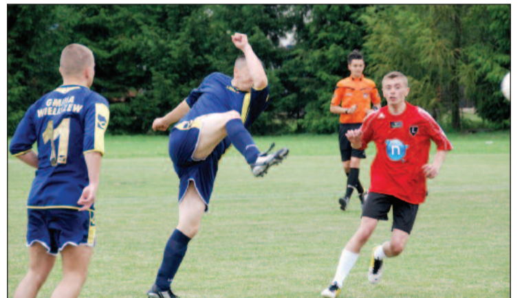
Na boiskach czterech gmin powiatu przez dwa dni trwały piłkarskie zmagania 25 drużyn. Na zdjęciu mecz Wieliszew kontra Teatr Ochoty na boisku w Wieliszewie.