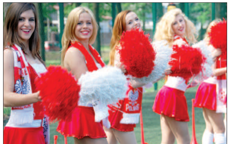
Uroczystości otwarcia i podsumowania MazoviaCup 2014 okrasily występy uroczych cheerleaderek z grupy Hasao Show Dance & Cheerleaders.