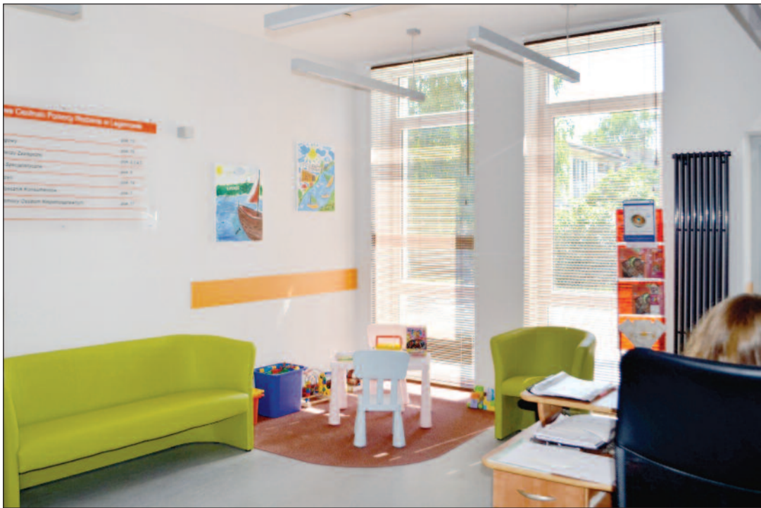
Nowa siedziba jest bardziej przyjazna dla osób załatwiających tu swoje sprawy. Udało się m.in. wygospodarować kąciak zabaw dla dzieci.