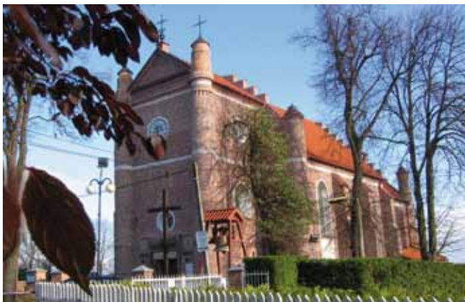
Kościół Zwiastowania Najświętszej Maryi Pannie w Serocku