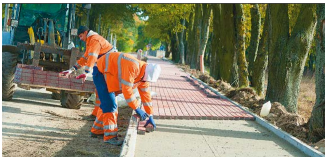
Roboty w Woli Kiełpińskiej idą zgodnie z planem