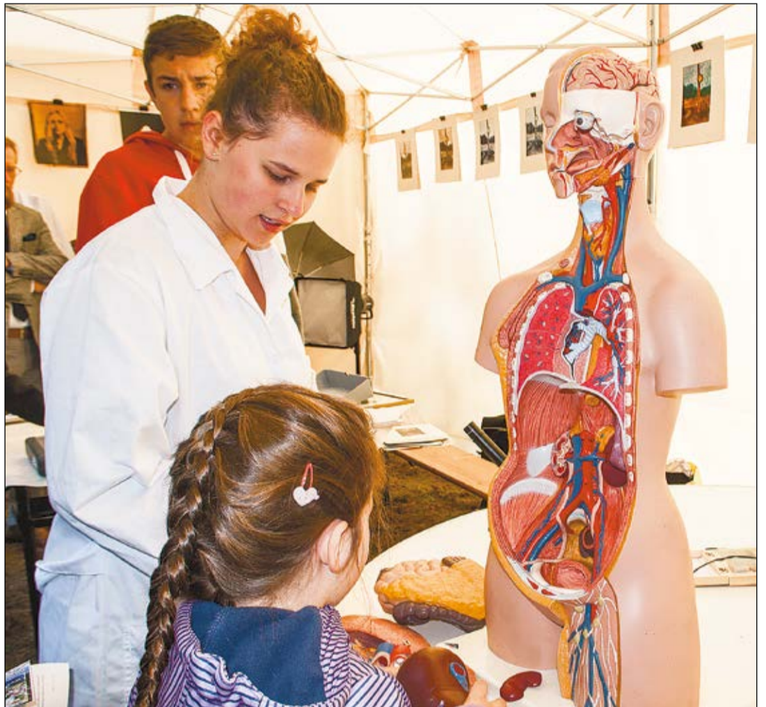
Festiwal Nauki w Jabłonnie to wyjątkowa okazja do zdobycia wiedzy i poznania nowinek z różnych dziedzin nauki w jednym miejscu i czasie

W XX Festiwalu Nauki w Jabłonnie wzięło udział 59 współorganizatorów, którzy przygotowali blisko 130 projektów tematycznych. Przy okazji tego wydarzenia, na stoisku Powiatu Legionowskiego, zorganizowaliśmy konkurs wiedzy o naszym regionie.