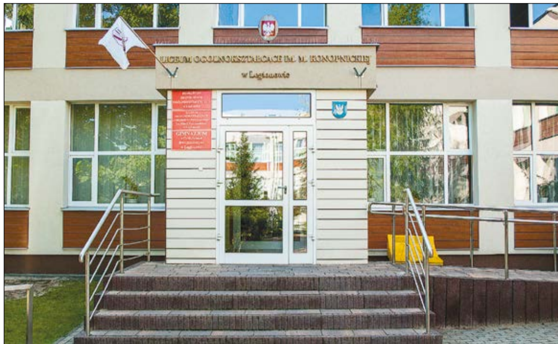
Budynek Liceum Ogólnokształcącego im. M. Konopnickiej w Legionowie

Wśród uczniów Liceum Ogólnokształcącego im. M. Konopnickiej są osoby niepełnosprawne ruchowo. Powiat zdobył środki finansowe na windę, dzięki której wszyscy będą mogli bez barier poruszać się między piętrami budynku LO. Dodatkowo pozyskał dotację na zakup nowego mikrobusa dla osób na wózkach inwalidzkich oraz na cele związane z ochroną lasów i środowiska naturalnego.