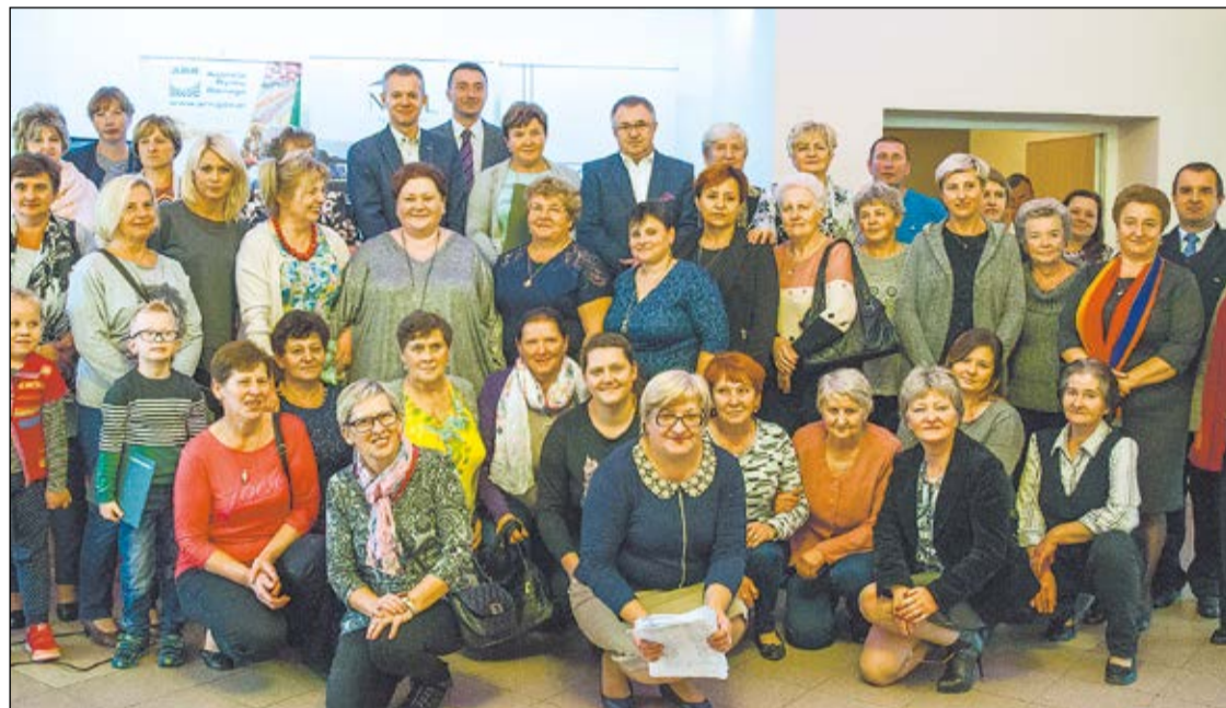
W tegorocznej edycji konkursu wystartowało 69 uczestników. Rywalizowały głównie panie, ale panowie też coraz chętniej biorą udział w kulinarnych zmaganiach

Knedle ze śliwkami, kielbaska z dzika i tort czekoladowy to tylko niektóre z potraw rywalizujących o miano najsmaczniejszej w organizowanym po raz dziewiąty konkursie „Najlepsza Potrawa Tradycyjna”, który odbył się 11 października w Woli Kiełpińskiej. Nagrody dla zwycięzców ufundował Powiat Legionowski.