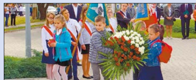
Młodzież złożyła kwiaty pod pomnikiem Alfry i Skiby

Uroczystość jubileuszu 20-lecia nadania imienia Szkole Podstawowej im. Armii Krajowej w Jabłonnie odbyła się 30 września br.