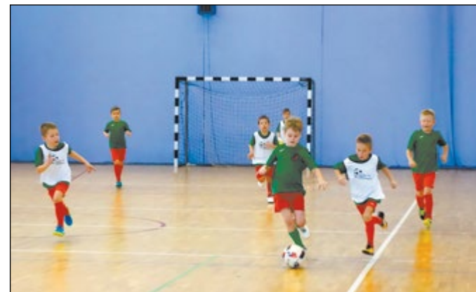
Organizatorami Piłkarskiej Ligi Powiatu Legionowskiego jest starostwo we współpracy z KS Sokół Serock

Trzecia seria turniejów Piłkarskiej Ligi Powiatu Legionowskiego została rozegrana na hali sportowej Powiatowego Zespołu Szkół Ponadgimnazjalnych w Serocku. Udział wzięło 21 zespołów, w których zagrało ponad 300 młodych piłkarzy.