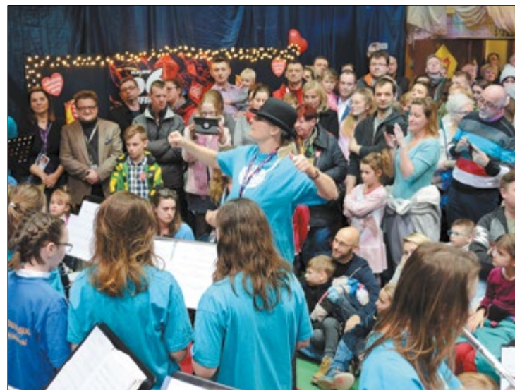
Legionowski sztab główny WOŚP w Powiatowym Zespole Szkół Ogólnokształcących pękał w szwach