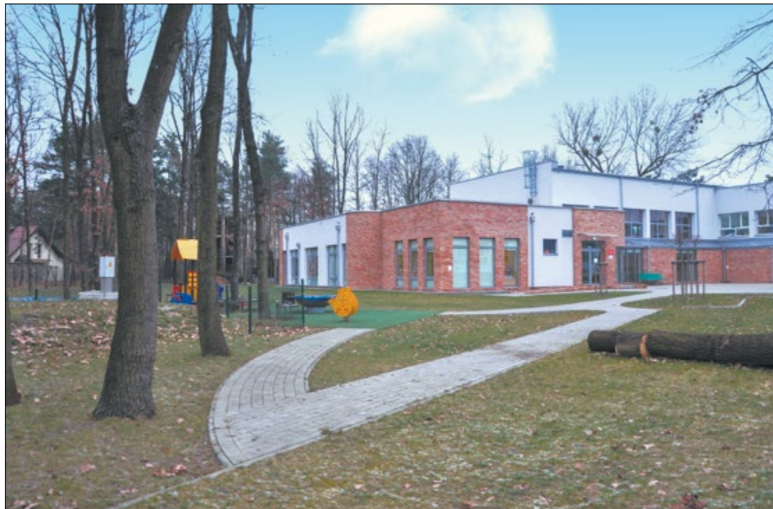
Na tyłach budynku PZSiPS, w północno-wschodniej części działki, powstanie dwupiętrowe skrzydło, w pełni dostosowane do potrzeb osób niepełnosprawnych