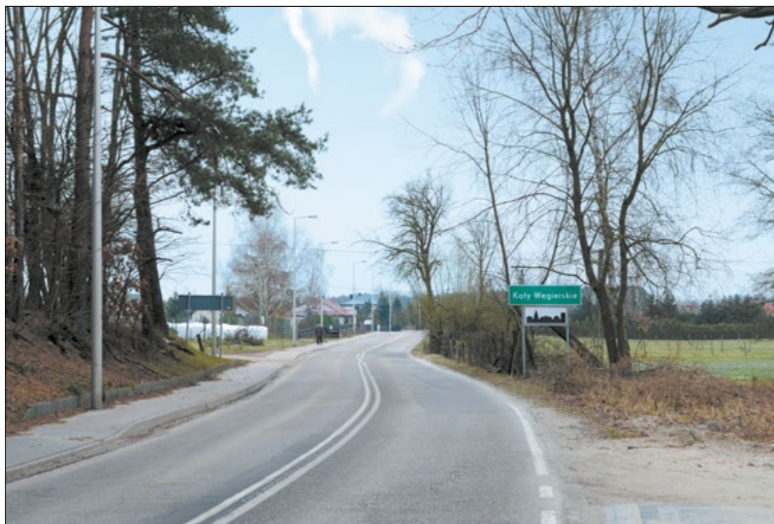
W tym roku Powiat przebuduje drogę między ul. Gajową w Woli Aleksandra, a ul. Kościelną w Kątach Węgieńskich