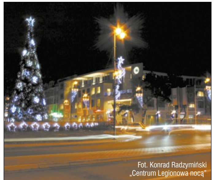
„Centrum Legionowa nocą”