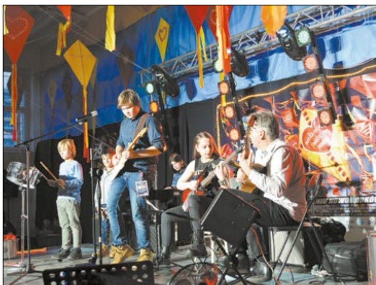
Organizatorzy przygotowali wiele atrakcji dla odwiedzających. Na scenie cały czas coś się działo

Gmina Nieporęt nie utworzyła sztabu, ale włączyła się w akcję na sportowo. Spontaniczna Akcja Ruchowa dla WOŚP na boisku przy Szkole Podstawowej w Józefowie zgromadziła tych, którzy połączyli dobroczynność z ruchem na świeżym powietrzu. W józefowskich lasach można było pobiegać i pojeździć na rowerach MTB, a na koniec spędzić czas na zabawie przy zimowym ognisku.