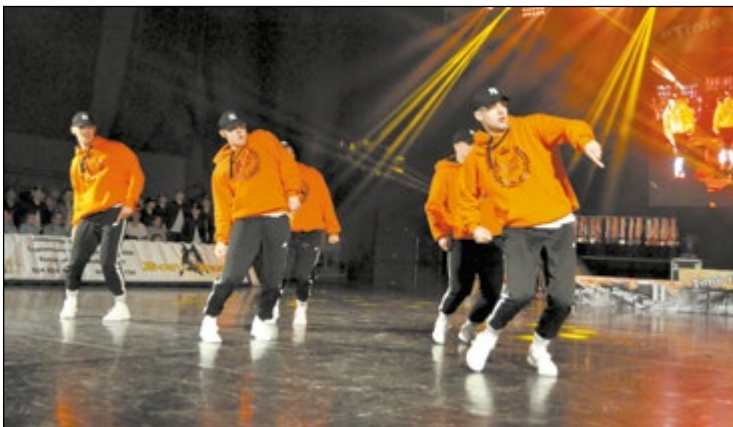
Grand Prix Turnieju Tanecznego „Time for Dance 2018” wytańczyła łódzka formacja Sztrymy Gang