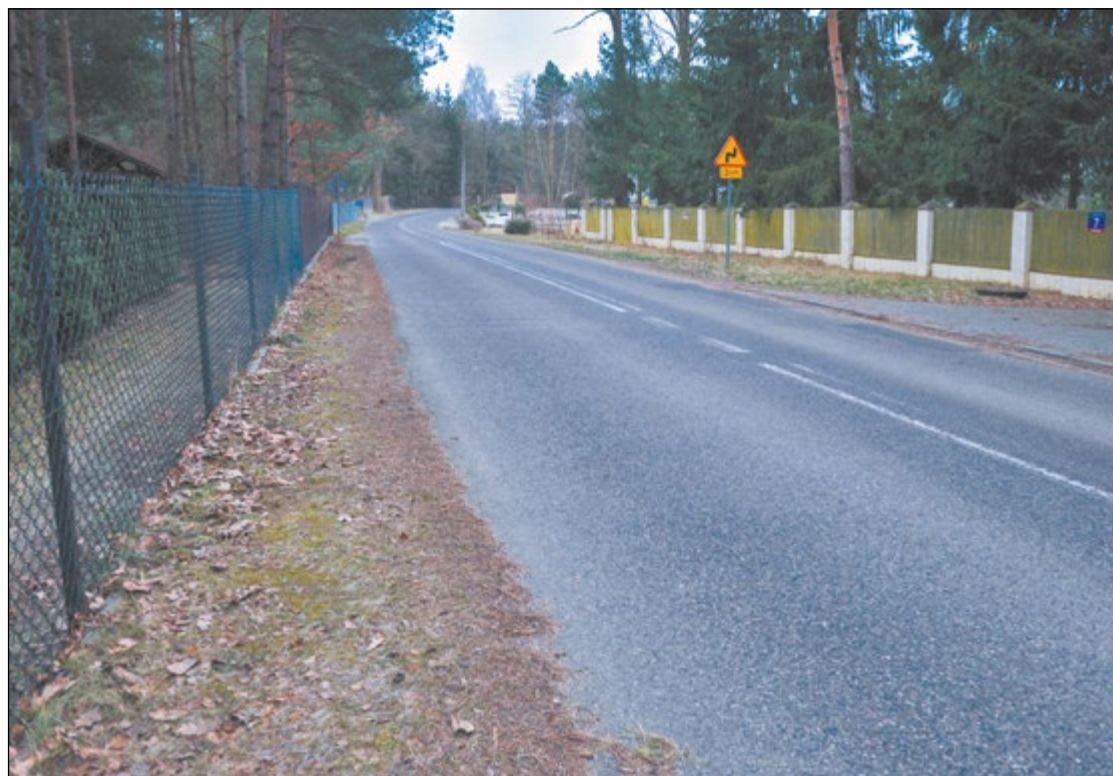
Z nowego chodnika w Komornicy będą mogli korzystać zarówno piesi, jak i rowerzyści