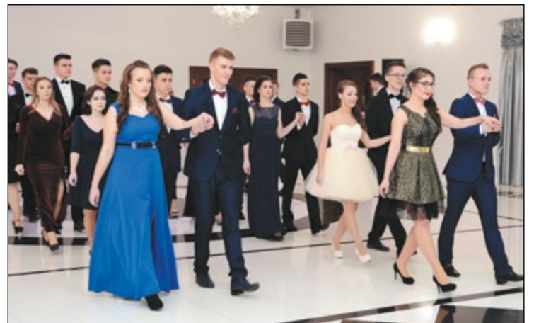
Uczniowie PZSP w Serocku bal studniówkowy tradycyjnie rozpoczęli polonezem

Dziś nie myślimy o maturze. Wraz z kolegami, koleżankami i nauczycielami świetnie się bawimy. To już ostatni nasz wspólny wieczór i towarzyszy mi wiele emocji. Sala jest piękna, stroje eleganckie, a humory dopisują. Zapamiętam ten bal na długo.