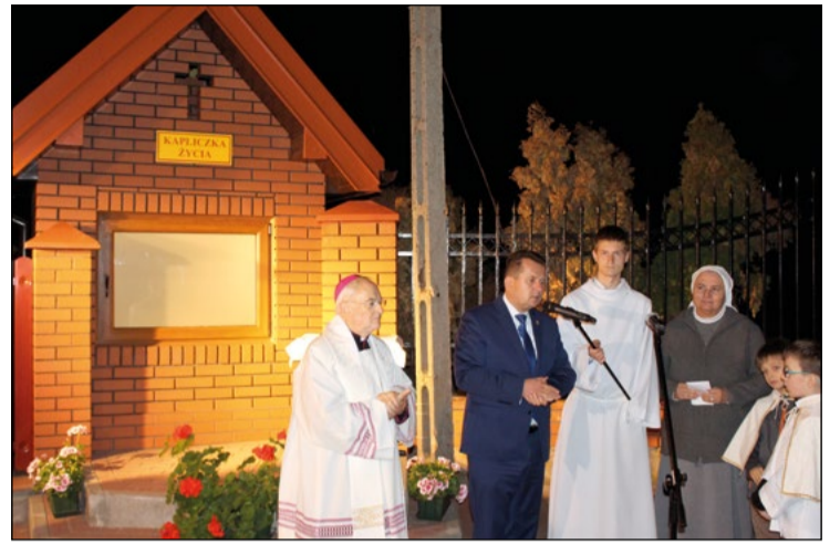
Na inicjatywę mieszkańca, by w mieście powstało okno życia, pozytywnie odpowiedzieli zarówno prezydent Legionowa, jak i Zgromadzenie Sióstr Urszulanek