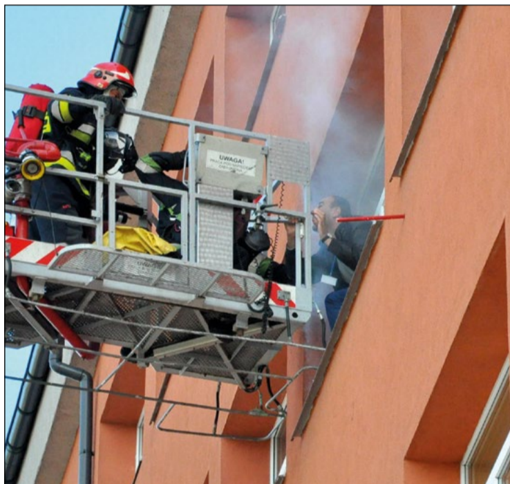
Strażacy interweniowali, jakby mieli do czynienia z prawdziwym pożarem

Sygnal alarmu przeciwpożarowego w starostwie postawił 9 października na nogi służby odpowiedzialne za bezpieczeństwo na terenie powiatu.