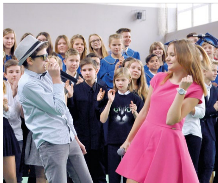
W powiatowym gimnazjum młodzież podarowała swoim wychowawcom w prezencie żywiołowe występy