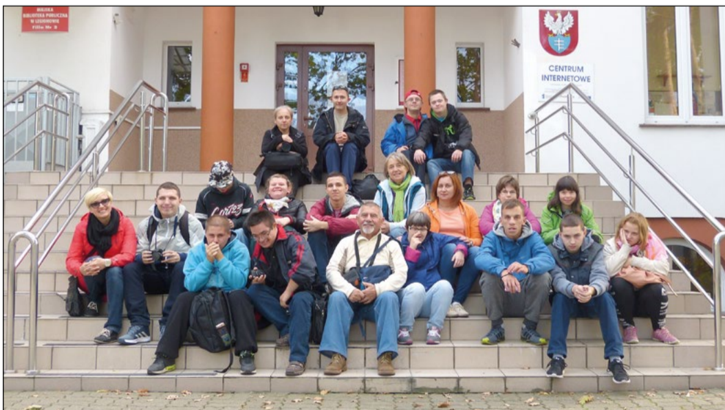
Uczestnicy warsztatów pod okiem profesjonalnego fotografa wyruszyli w teren, by w praktyce wykorzystać nabytą wiedzę

Warsztaty fotograficzne i wystawa fotograficzna to elementy projektu realizowanego przez Fundację „Promień Słońca”. Uczestniczą w nim uczniowie z powiatowej szkoły specjalnej.