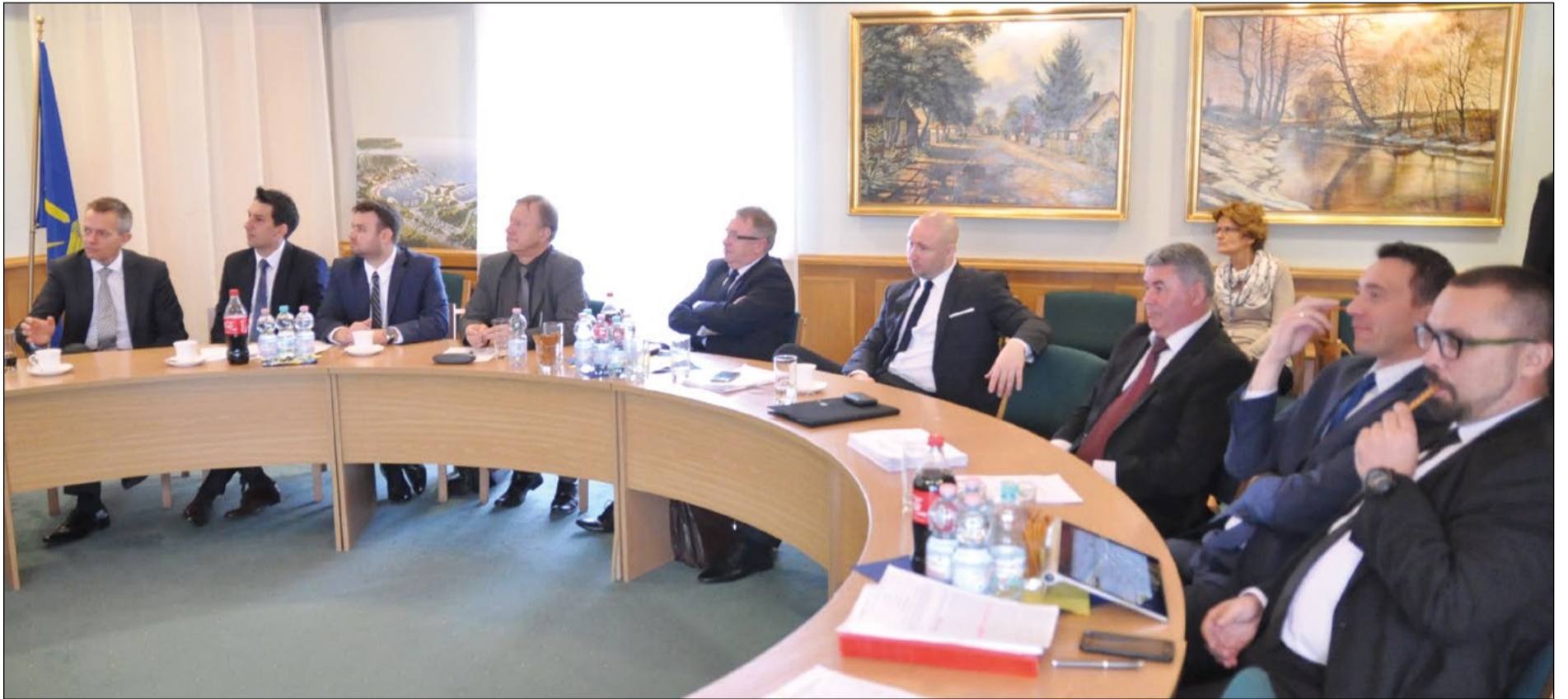
Głównym tematem Konwentu Samorządowego Powiatu Legionowskiego była budowa dróg na terenie powiatu