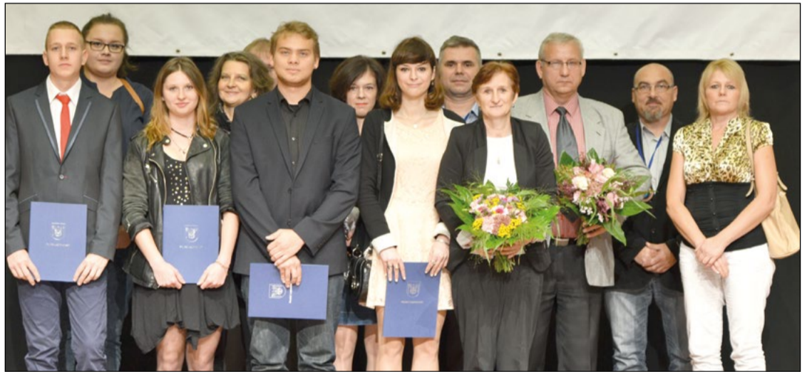
Najlepsi uczniowie powiatu z rodzicami