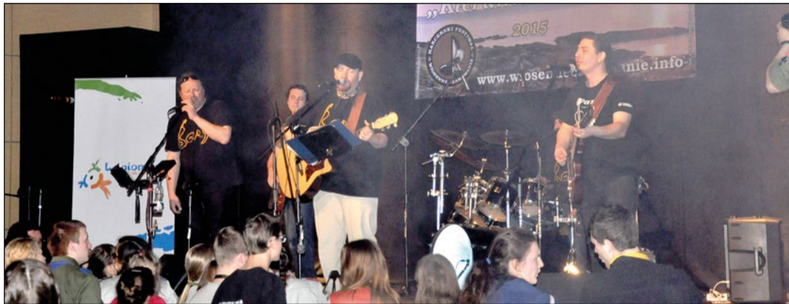
Występ formacji B.O.R.Y. porwał uczestników festiwalu do wspólnego śpiewania i tańca.

Ponad 500 uczestników z całego kraju wzięło udział w VI Harcerskim Festiwalu Piosenki „Wiosenne Czarowanie” w przedostatni weekend kwietnia.