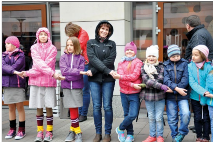
Na pożegnanie uczestnicy „Wiosennego Czarowania” stworzyli tradycyjny harcerski krąg.