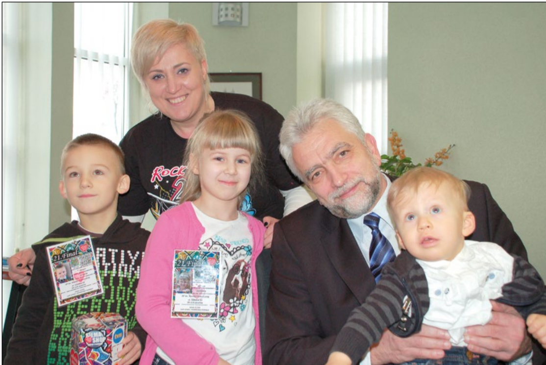
Wolontariusze WOSP w Urzędzie Gminy w styczniu 2013 r.

środków. Przykładem mogą być wypowiedzi w sprawie powodzi: „Powódź jest dlatego, że wybraliście sobie takiego wójta, który jej nie przeciwdziałał.” Ale nie mówi się już, że my w tym zakresie działamy jak pogotowie ratunkowe – mamy zorganizować ewakuację, zabezpieczenie, działania straży pożarnych. Natomiast walami przeciwpowodziowymi opiekują się podmioty administracji rządowej. Ponadto musimy dokładać do inwestycji takich jak drogi powiatowe, wojewódzkie czy krajowe oraz wspomagać instytucje jak policja, straż pożarna, RZGW czy WZIR.