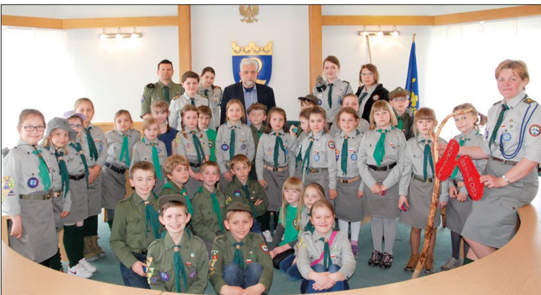
Wizyta harcerzy ze Szczepu 14 DH i GZ Nieporęt w Urzędzie Gminy – 2014 r.