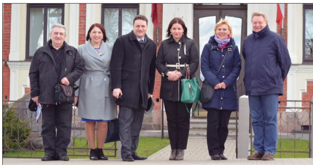
Delegacja powiatu i miasta przed Domem Polskim w Daugapils na Łotwie.

Brasławszczyzna to magiczny region o nieskażonej przyrodzie i otwartych ludzkich sercach. Tam na zaproszenie lokalnych władz udała się delegacja Powiatu Legionowskiego i Miasta Legionowo.