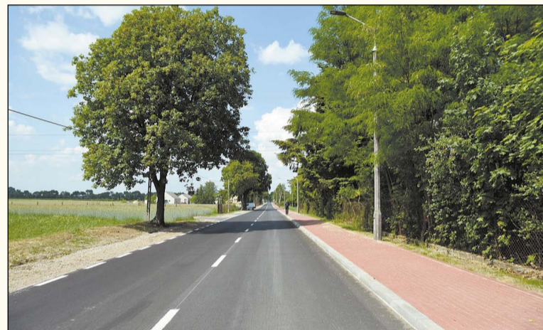
Dziesiątki kilometrów przebudowanych dróg powiatowych w tej kadencji, czyli komfort i bezpieczeństwo przede wszystkim

Powiat realizuje też Program Ochrony Zdrowia Psychicznego dla mieszkańców. Zakłada on realizację