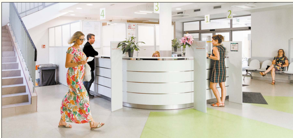
Prowadzone przez Powiat ambulatorium chirurgiczno-urazowe zlokalizowane jest w budynku ZOZ „Legionowo”, w którym kilka miesięcy temu Powiat zakończył całkowitą modernizację

Obecnie do flagowych eventów organizowanych przez PIK należą między innymi: cykl „Kino Otwarte” oraz „Kino Otwarte na Sztukę”; letnie plenery malarskie - „ArchiPlenery” oraz „KrajObrazy; wydarzenia związane z obchodami Roku Lema - warsztaty artystyczne związane z twórczością Stanisława Lema, których podsumowaniem będzie futurystyczne widowisko - performance „Lemowskie konstelacje/instalacje”; konkursy na profilu na FB w postaci rebusów artystyczno-filmowych; plenerowy Festiwal Filmowy im. Andrzeja Kondratiuka „Ach, czego się nie robi dla sztuki!”; spotkania autorskie z twórcami literatury dziecięcej, jak i pisarzami cenionymi przez dorosłych czytelników; „Książka w (o)biegu” - impreza, podczas której