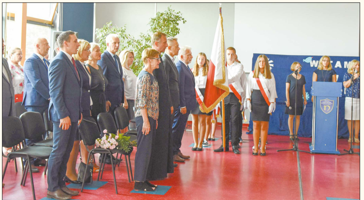
Utworzenie Liceum Ogólnokształcącego w Stanisławowie Pierwszym to największe przedsięwzięcie oświatowe Powiatu w ostatnich latach. Pierwsza inauguracja roku szkolnego w nowej placówce odbyła się 2 września 2019 roku

Przewozów Autobusowych poprzez dopłatę do ceny usługi dla dwóch linii autobusowych, dla których organizatorem jest Powiat Legionowski – dotacja 877 776,75 zł, • zakup diagnostycznego sprzętu medycznego dla zapewnienia kompleksowej realizacji