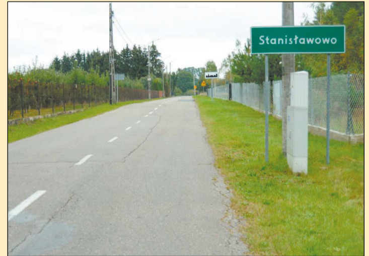
Blisko pięciokilometrowy odcinek drogi wymaga przebudowy, według planów nastąpi to jeszcze w tym roku

Trwa postępowanie przetargowe mające na celu wyłonienie wykonawcy przebudowy drogi powiatowej nr 1801W na trasie Stanisławowo – Ludwinowo Dębskie – Zabłocie w gminie Serock. W tegorocznym budżecie powiatu legionowskiego zabezpieczono 7 mln zł na ten cel, z czego blisko 5,3 mln zł pochodzić będzie ze środków Rządowego Funduszu Inwestycji Lokalnych.