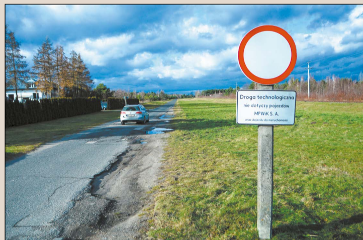
„Mała obwodnica Wieliszewa”, czyli droga planowana po śladzie obecnej trasy wodociągowej, wyprowadzi ruch z centrum Wieliszewa i usprawni go w całej gminie

Powiat Legionowski planuje przebudować trzy drogi na terenie gminy Wieliszew. Podczas spotkania roboczego, które odbyło się 26 stycznia w starostwie, konsultowano charakter projektowanych inwestycji.