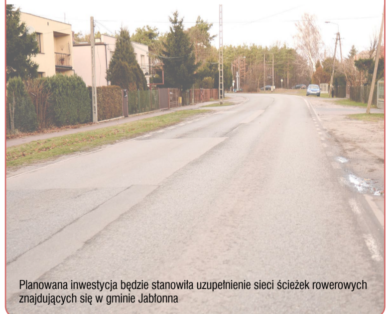
Planowana inwestycja będzie stanowiła uzupełnienie sieci ścieżek rowerowych znajdujących się w gminie Jabłonna