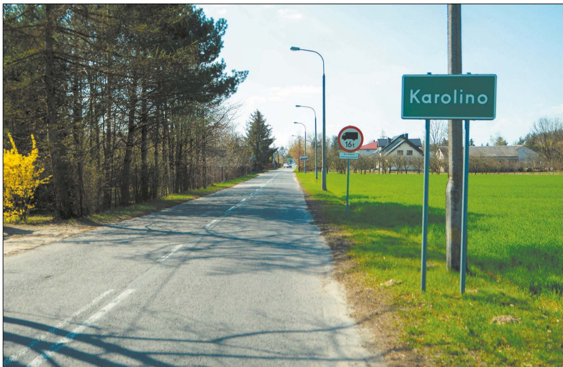
Przebudowa drogi w Karolinie znacząco wpłynie na bezpieczeństwo i komfort kierowców oraz pieszych

Umowa na realizację przebudowy drogi powiatowej nr 1807W w gminie Serock została podpisana 9 lutego.