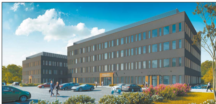
Wizualizacja budynków sądu i prokuratury w Legionowie