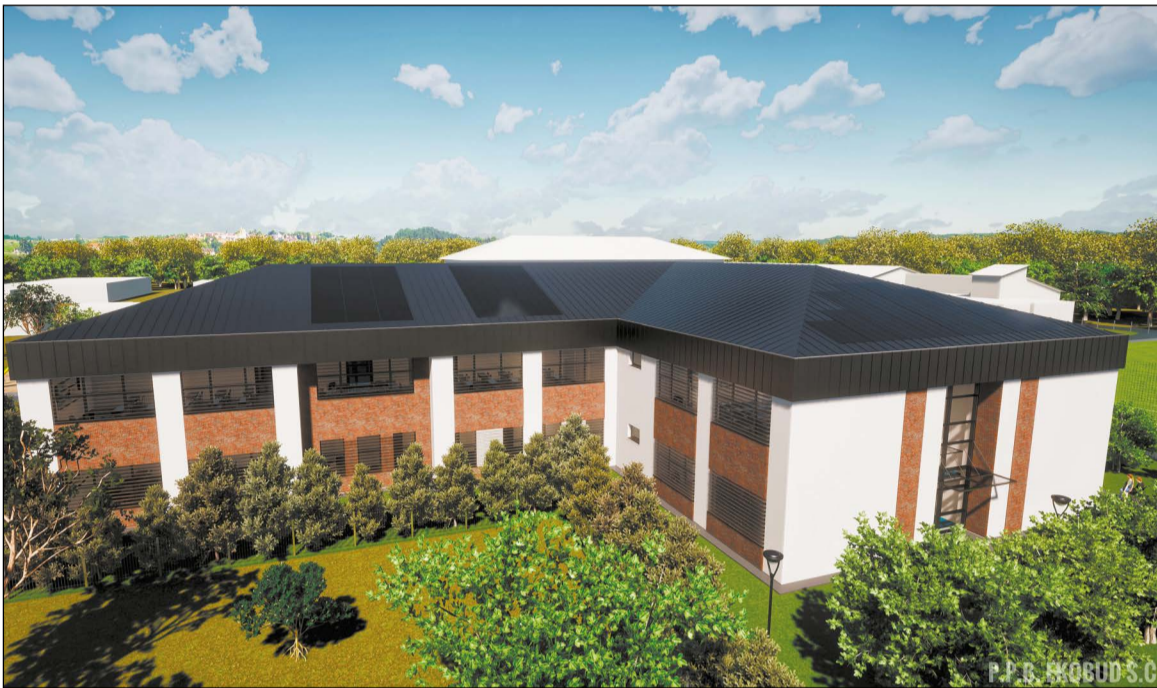
Wizualizacja budynku Liceum Ogólnokształcącego im. Stanisława Lema w Stanisławowie Pierwszym, którego budowa ruszy w tym roku

Niecałe dwa miesiące temu Rada Powiatu w Legionowie uchwaliła budżet na 2022 rok. Blisko 30 proc. wydatków powiatu, bo prawie 46 mln zł, stanowią środki przeznaczone na oświatę. W bieżącym roku wydatki, jakie zaplanowano na publiczną oświatę, są aż o 9 mln zł większe niż w roku ubiegłym. Na co są wydawane?