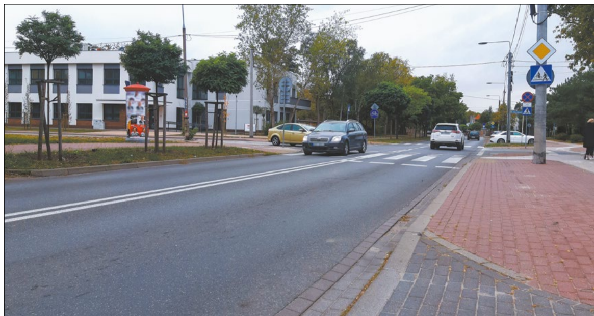
Budowa ronda u zbiegu ulic Jagiellońskiej i Mickiewicza w Legionowie to jedno z zadań, które otrzymało dofinansowanie z Rządowego Funduszu Polski Ład: Program Inwestycji Strategicznych

Powiat Legionowski pozyskał kolejne środki, które powiększą budżet inwestycyjny. Dzięki nim na naszym terenie przebudowane zostaną trzy drogi oraz poddane konserwacji dwa obiekty zabytkowe.