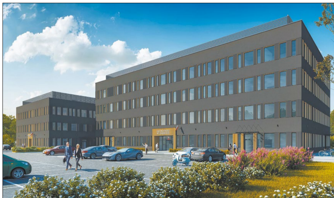
Wizualizacja budynków sądu i prokuratury w Legionowie

Dobłą informacją dla Powiatu Legionowskiego jest fakt podpisania 11 października br. umowy na budowę nowej siedziby Sądu Rejonowego i Prokuratury Rejonowej. W kadencji 2018-2024 powstała w naszym powiecie nowa szkoła, strażnica Komendy Powiatowej Państwowej Straży Pożarnej w Legionowie, szpital. Będziemy też rozbudowywać starostwo. Nowy budynek sądu i prokuratury to kolejna dobra inwestycja w ważne obiekty infrastruktury publicznej, tak by mieszkańcy mogli załatwiać swoje sprawy w bardziej komfortowych warunkach.