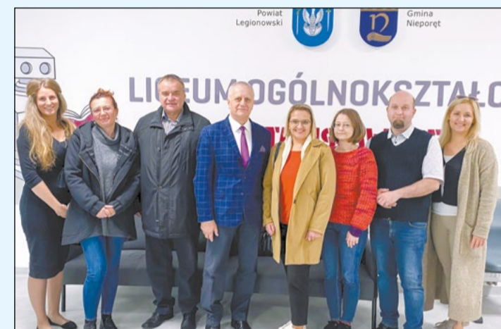
Delegacja z chorwackiej Čazmy gościła między innymi w nowej siedzibie Liceum Ogólnokształcącego im. Stanisława Lema w Stanisławowie Pierwszym

W połowie października nasz powiat odwiedziła delegacja z Čazmy w Chorwacji – partnerskiej gminy Powiatu Legionowskiego.