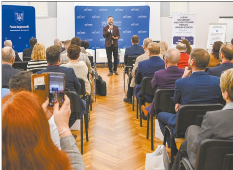
Współpraca przedstawicieli trzech sektorów daje realną szansę na wprowadzenie pozytywnych zmian w życiu lokalnej społeczności powiatu legionowskiego

O współpracy samorządu z organizacjami pozarządowymi, roli przedsiębiorców w budowaniu partnerstw międzysektorowych i współpracy jako najlepszej lokalnej inwestycji społecznej rozmawiali uczestnicy I Forum Współpracy Międzysektorowej Powiatu Legionowskiego, które zorganizowano 26 października w siedzibie Starostwa Powiatowego w Legionowie. Wszystkie debaty można obejrzeć na fanpage'u Powiatu Legionowskiego na Facebooku oraz na powiatowym kanale w serwisie YouTube.