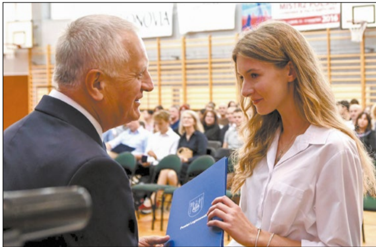
Nagrody Starosty Legionowskiego dla najlepszych uczniów to uznanie wysiłku włożonego w naukę i zachęta do dalszych starań

86 uczniów otrzymało nagrody Starosty Legionowskiego za znakomite wyniki w nauce. Wszyscy mogą pochwalić się średnią ocen 5.0 i wyższą.