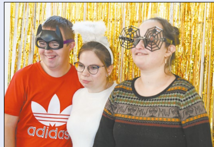
Konkursy, quizy i zabawa przy muzyce to recepta na udane spędzenie czasu

Ostatni dzień listopada był dla członków Koła Pomocy Dzieciom Specjalnej Troski TPD Legionowo oraz dzieci z rodzin zastępczych i placówek opiekuńczo-wychowawczych wyjątkowy. W auli Starostwa Powiatowego Centrum Integracji Społecznej w Legionowie zorganizowało dla nich pełną atrakcyjną zabawę andrzejkową.