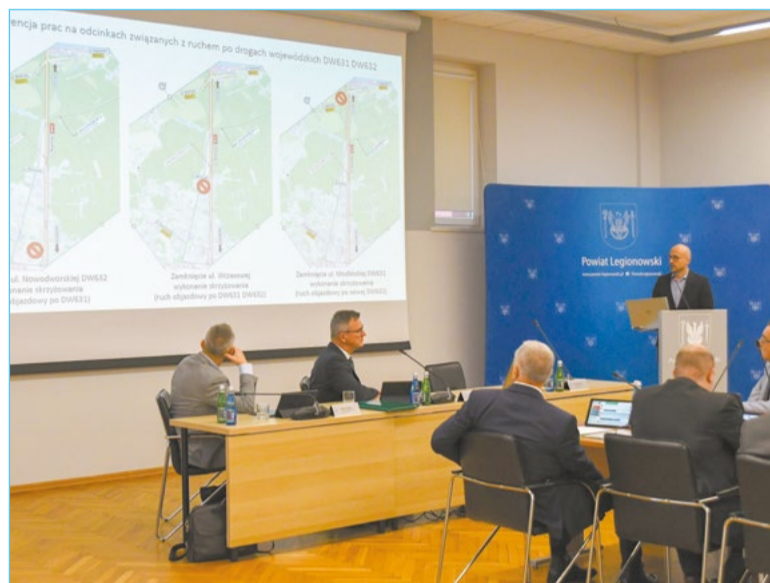
Powiatowi radni wysłuchali sprawozdań z realizacji inwestycji związanych z budową kolei Zegrze Płd. – Przasnysz oraz przebudową DK 61

Postępy prac i harmonogramy dotyczące dwóch dużych inwestycji realizowanych na terenie powiatu – budowy Kolei Północnego Mazowsza (z Zegrza Południowego do Przasnysza) i przebudowy DK 61 – zaprezentowali podczas listopadowej sesji Rady Powiatu w Legionowie zaproszeni przedstawiciele inwestorów.