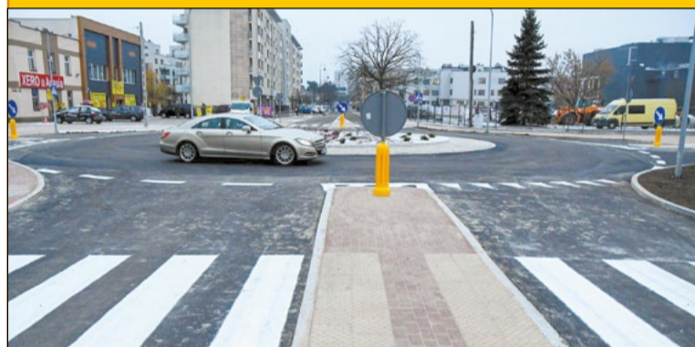
Zadanie pn. „Rozbudowa skrzyżowania drogi powiatowej nr 1819W – ul. Jagiellońskiej z drogą gminną ul. Słowackiego w Legionowie wraz z infrastrukturą” zostało zrealizowane w ramach Rządowego Funduszu Rozwoju Dróg

Przebudowa skrzyżowania ulic Jagiellońskiej ze Słowackiego to jedna z tych inwestycji, na której realizację zmotoryzowani mieszkańcy bardzo liczyli i czekali. Z uwagi na duży ruch w tym miejscu często dochodziło do kolizji, a wyjazd z dróg podporządkowanych był utrudniony. Nowo powstałe rondo ma usprawnić ruch oraz poprawić bezpieczeństwo naszych mieszkańców. Od niemal miesiąca możemy cieszyć się bezpiecznym rozwiązaniem, które zastosowano w tej lokalizacji.