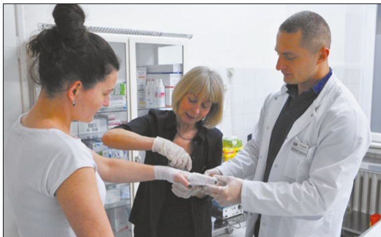
Od nowego roku ambulatorium chirurgiczno-urazowe w legionowskiej przychodni przy ul. Sowińskiego 4 będzie funkcjonować tylko w weekendy i święta

Powiatowy NZOZ „Legionowo” dostosowuje zakres działania do zmieniających się potrzeb pacjentów. Stąd prowadzone tam ambulatorium chirurgiczno-urazowe będzie od początku 2024 r. czynne w weekendy i święta w godzinach 8.00 - 24.00. Zmiana zapewni mieszkańcom opiekę w przypadkach, gdy inne podmioty oferujące opiekę ambulatoryjną nie działają.