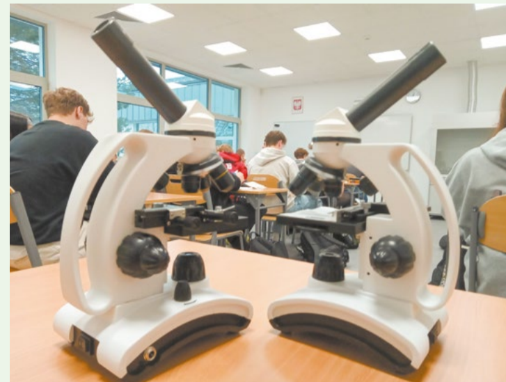
Nowe mikroskopy w LO im. S. Lema w Stanisławowie Pierwszym

Dodatkowe środki zewnętrzne w łącznej kwocie ponad 665 tys. zł zasiliły oświatowy budżet powiatu.