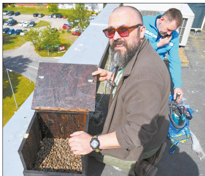
Druga budka lęgowa dla pustulek jest już zamontowana