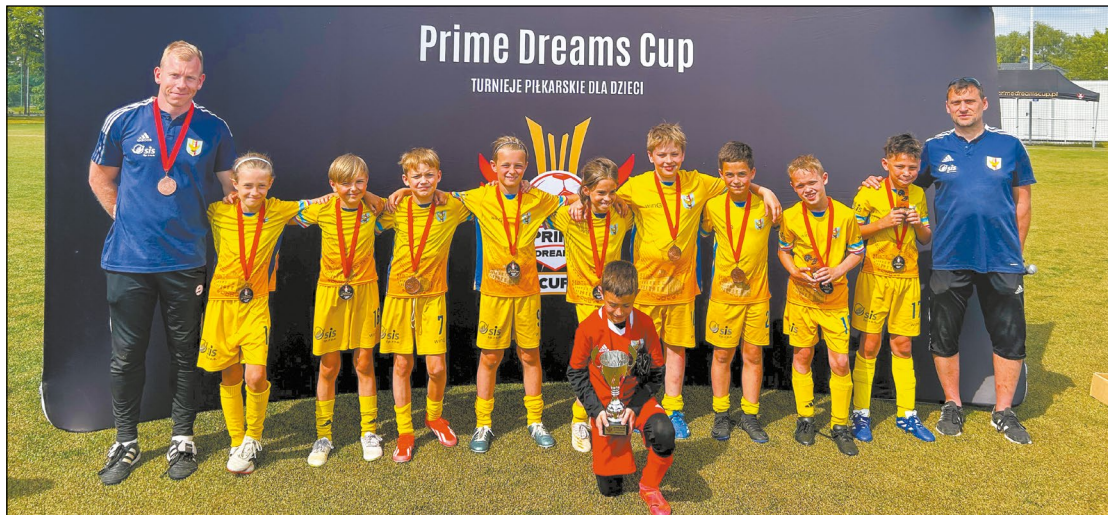
Rocznik 2014 Klubu Sportowego Sokół Serock

Podczas turnieju Prime Dreams Cup trenerzy wybierali reprezentantów Powiatu Legionowskiego z rocznika 2014.