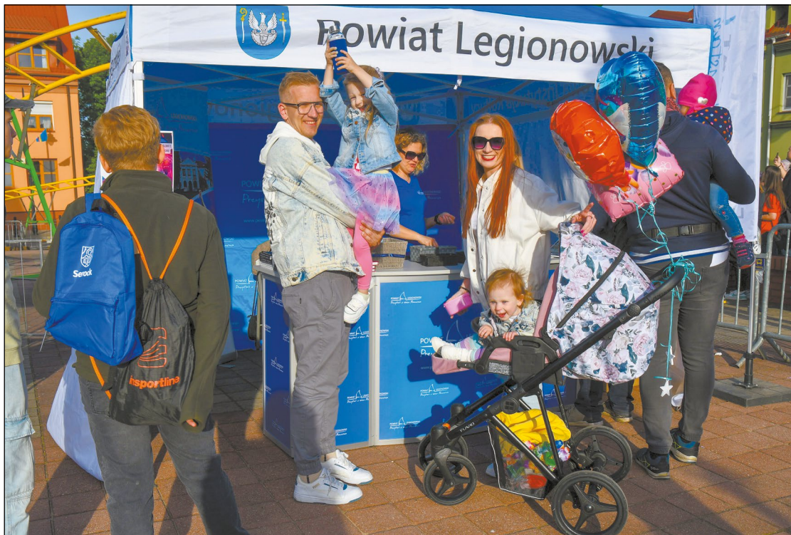
Stoisko Powiatu Legionowskiego podczas Wojciechowego Świętowania w Serocku

Przełom maja i czerwca to czas gminnych świąt w powiecie. Tradycyjnie pojawia się na nich również stoisko promocyjne Powiatu Legionowskiego. Byliśmy już w Serocku, będziemy w Wieliszewie, Legionowie i Nieporęcie.