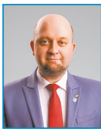
Konrad Michalski Wicestarosta Legionowski