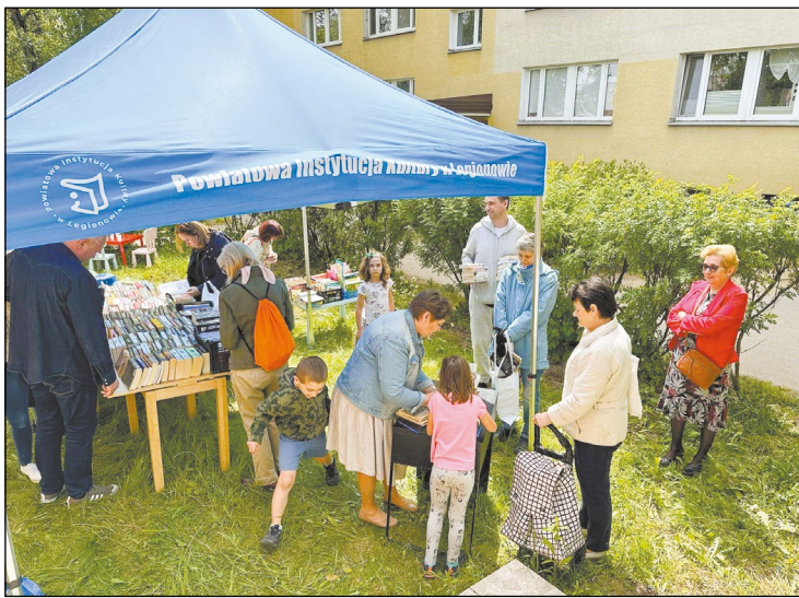
Książka w (o)biegu dała czytelnikom okazję do odświeżenia domowych biblioteczek. Przeczytane już książki ustąpiły miejsca nowym pozycjom

Co roku w maju obchodzimy święto bibliotek i bibliotekarzy. Tradycyjnie 8 maja ruszył Ogólnopolski Tydzień Bibliotek. Hasło przewodnie tegorocznej edycji brzmiało „Biblioteka – miejsce na czasie”. Biblioteki z terenu powiatu legionowskiego przygotowały na ten czas moc atrakcji, udowodniając, że są miejscem ponadczasowym.