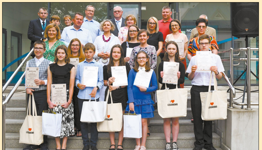
Na zdjęciu laureaci i organizatorzy XV edycji Konkursu Wiedzy o Polskim Państwie Podziemnym, Armii Krajowej i Szarych Szeregach