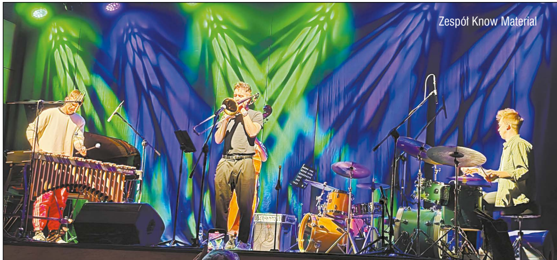
Zespół Know Material

Kolejna odsłona Mazowieckiego Jazz Jam Legionowo, organizowanego przez Miejski Ośrodek Kultury w Legionowie od 2016 roku, odbyła się w dniach 18-20 października. Powiat Legionowski tradycyjnie był współorganizatorem wydarzenia.