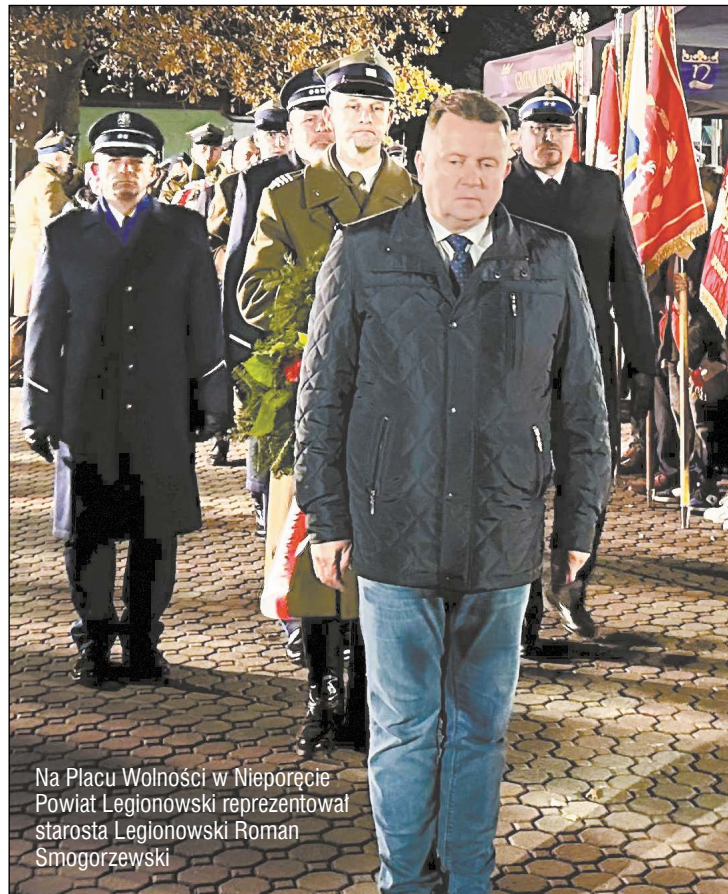
Na Placu Wolności w Nieporęcie Powiat Legionowski reprezentował starosta Legionowski Roman Smogorzewski