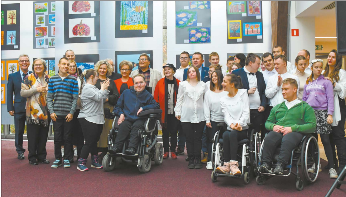
Pełne kolorów i emocji prace, które zawisły w legionowskim ratuszu, prezentują talent artystów z niepełnosprawnościami

W legionowskiej Galerii Sztuki „Ratusz” do 30 listopada można podziwiać wystawę „Malowane sercem 2024”, na której prezentowane są prace uczniów Powiatowego Zespołu Szkół i Placówek Specjalnych w Legionowie.