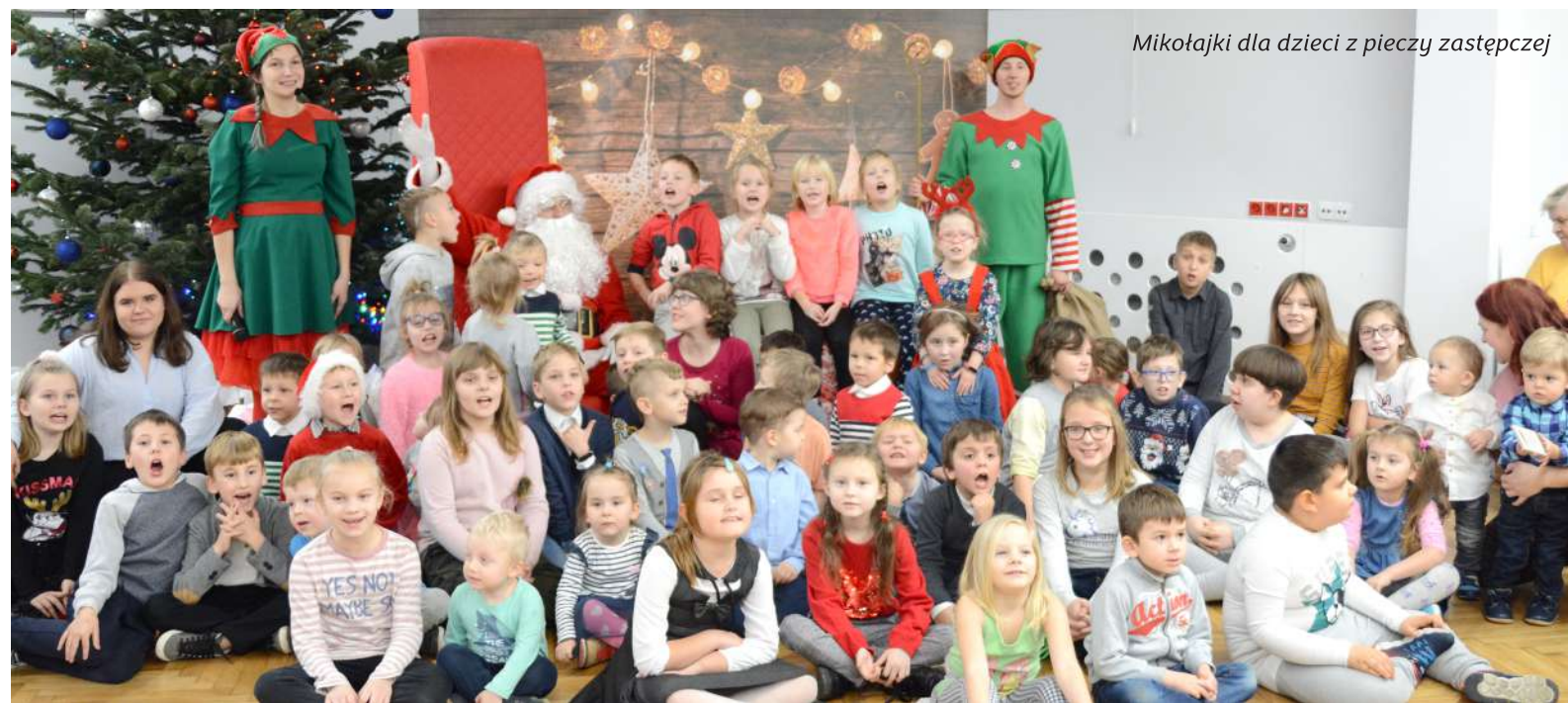
Mikołajki dla dzieci z pieczy zastępczej