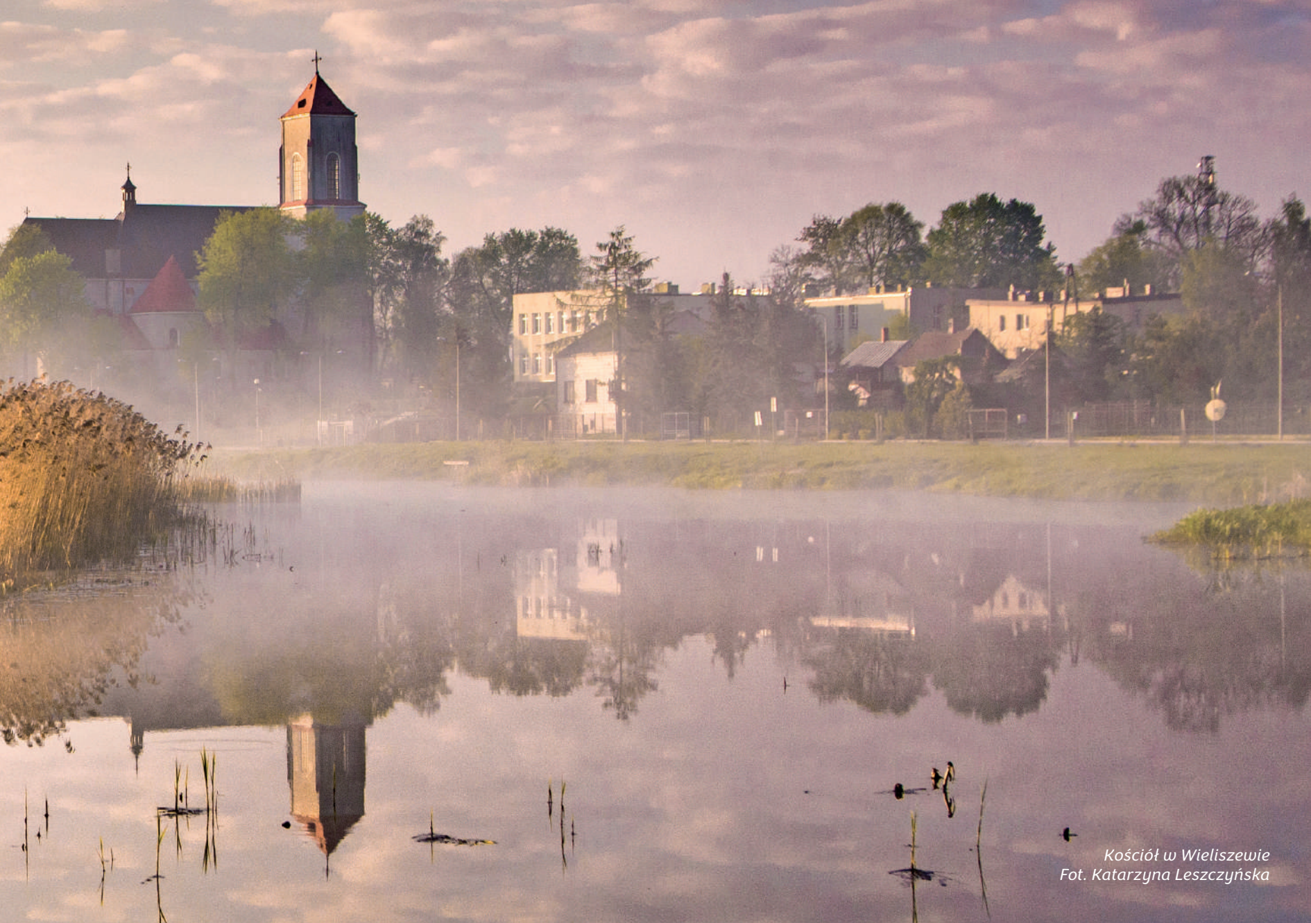
Kościół w Wieliszewie