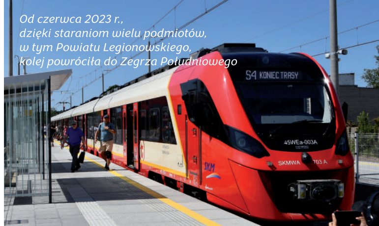
Od czerwca 2023 r., dzięki staraniom wielu podmiotów, w tym Powiatu Legionowskiego, kolej powróciła do Zegrza Południowego

gruczołu krokowego oraz konsultacje psychiatryczne i psychologiczne. W ramach programów zdrowotnych realizowano także szkolenia, warsztaty i wykłady m. in. z samobadania piersi czy udzielania pierwszej pomocy przedmedycznej wraz z nauką obsługi defibrylatora.