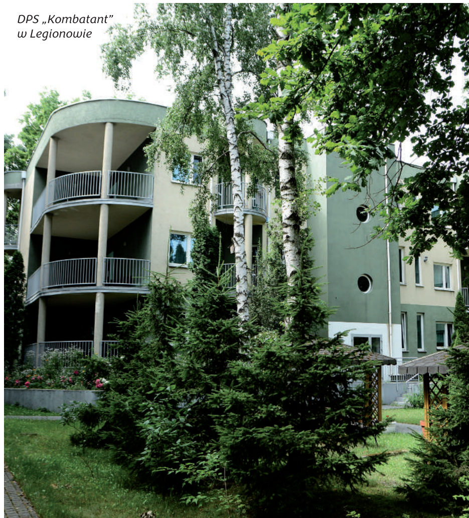
DPS „Kombatant” w Legionowie