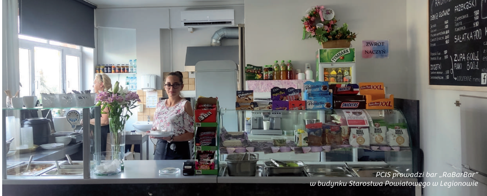
PCIS prowadzi bar „RaBarBar” w budynku Starostwa Powiatowego w Legionowie