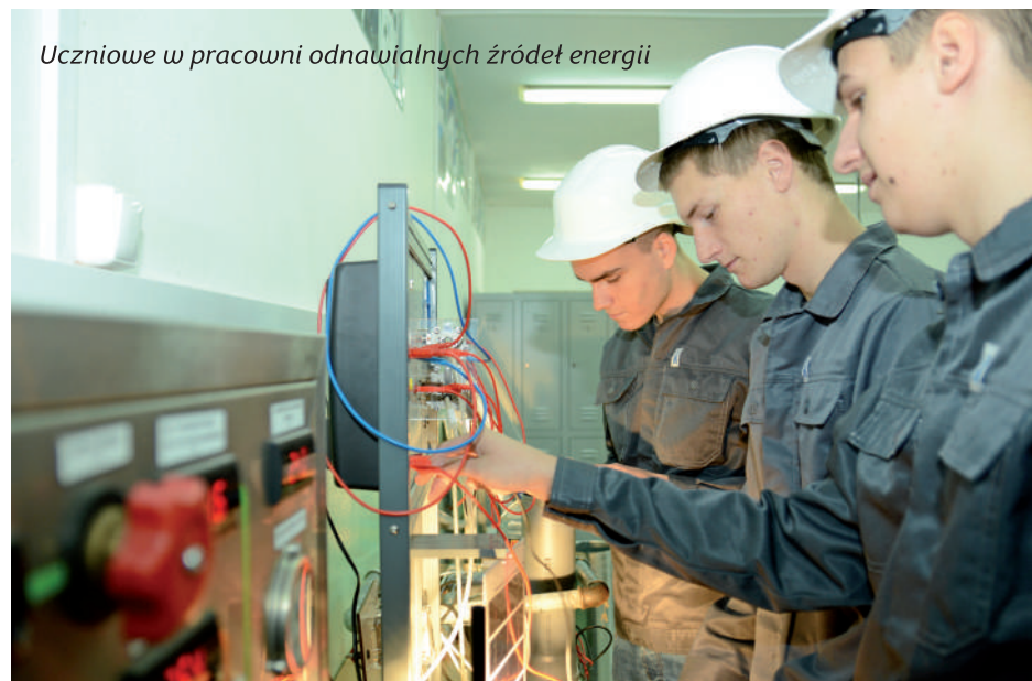
Uczniowie w pracowni odnawialnych źródeł energii

Katarzyna Jóźwik-Kaliszewska (2019 – dziś)