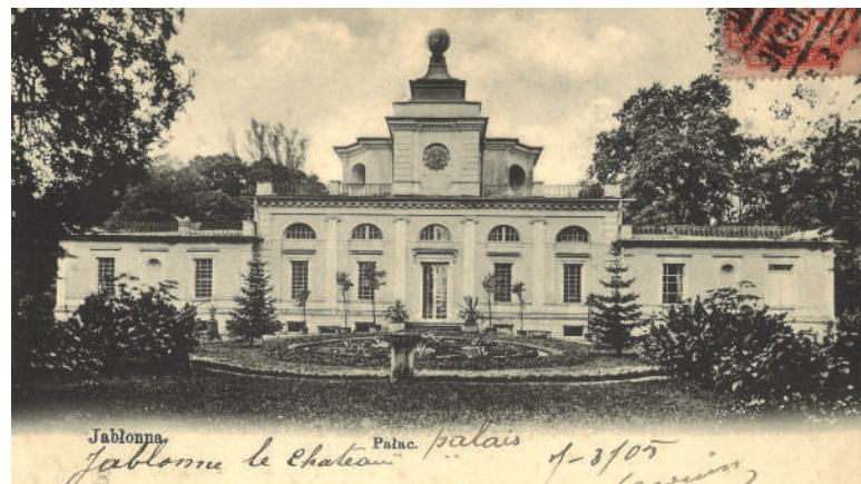
Pocztówka z 1905 roku przedstawiająca pałac w Jabłonii.

Niewiele młodszy jest Nieporęt. Niewątpliwie na jego rozwój ogromny wpływ miało wybudowanie dworu myśliwskiego przez Zygmunta III Wazę. Dwór był ulubionym miejscem odpoczynku Wazów. Po śmierci Zygmunta gościli tu jego synowie: Władysław IV i Jan Kazimierz. Temu ostatniemu miejscowość zawdzięcza kościół,