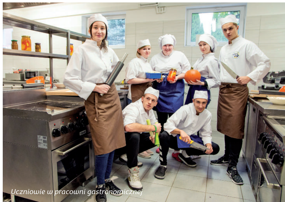
Uczniowie w pracowni gastronomicznej