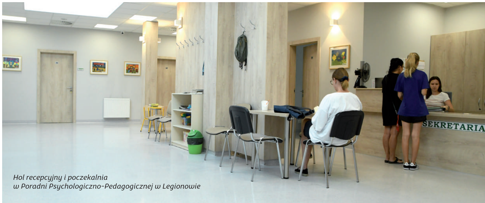
Hol recepcyjny i poczekalnia w Poradni Psychologiczno-Pedagogicznej w Legionowie