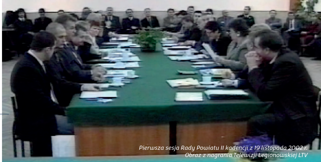
Pierwsza sesja Rady Powiatu II kadencji z 19 listopada 2002 r. Obraz z nagrania Telewizji Legionowskiej LTV