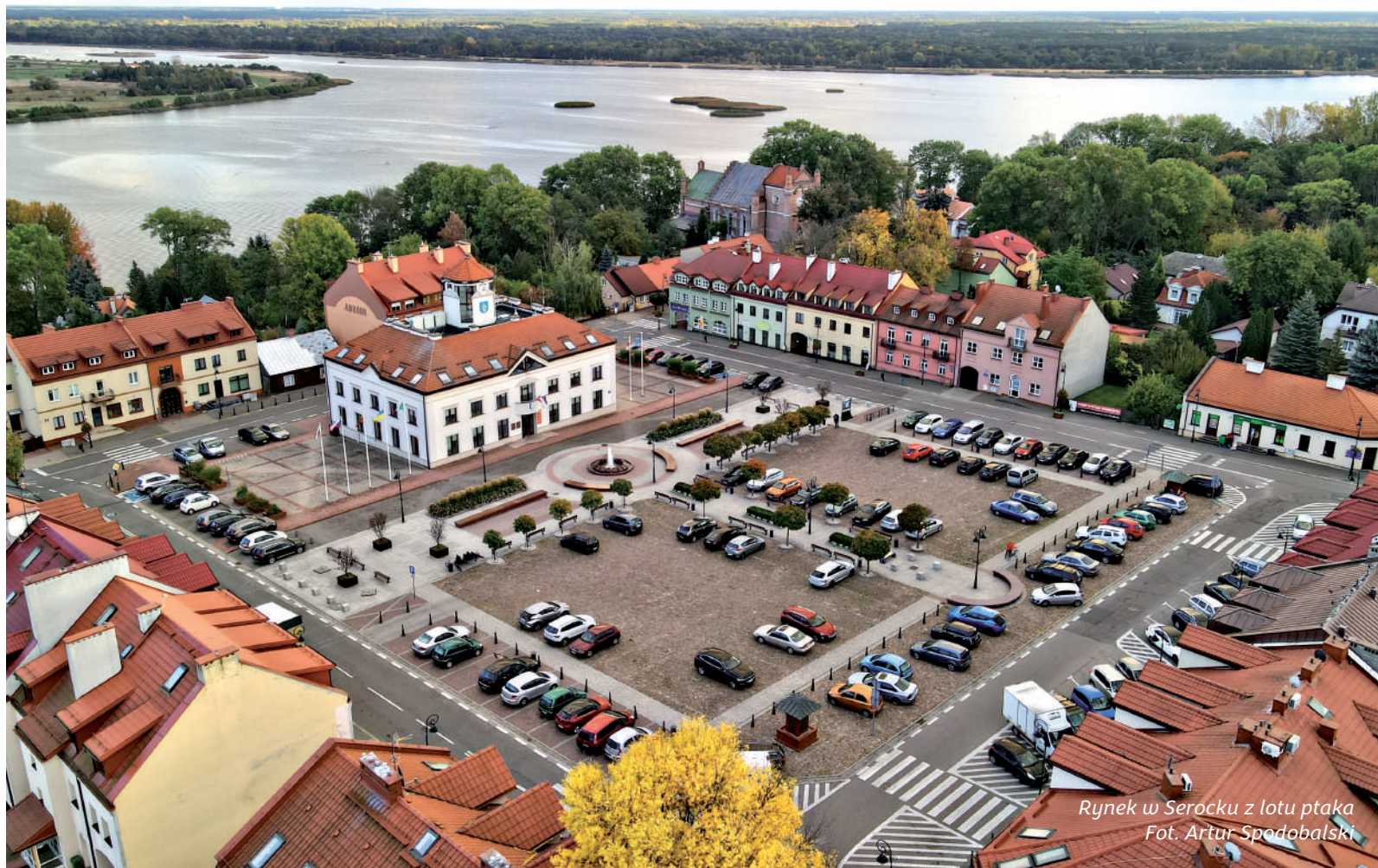
Rynek w Sierocku z lotu ptaka