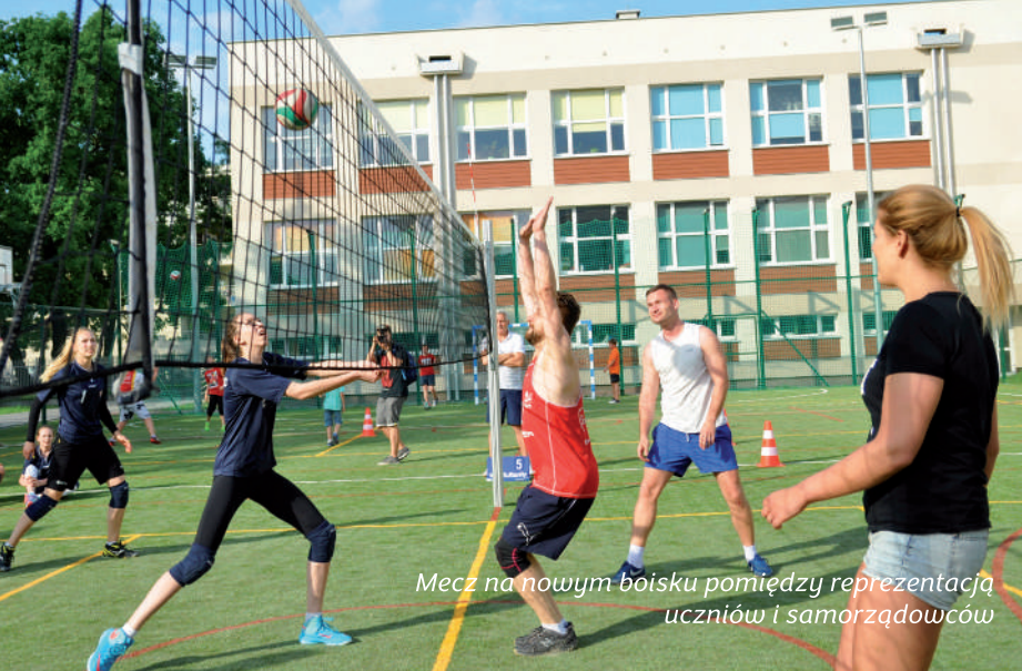
Mecz na nowym boisku pomiędzy reprezentacją uczniów i samorządowców