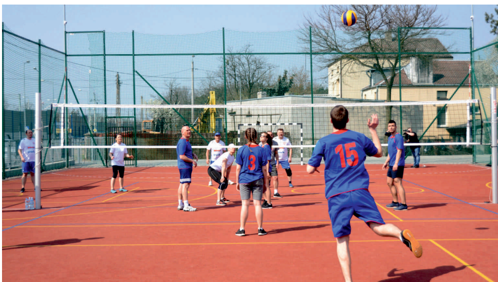
Zewnętrzne wielofunkcyjne boisko sportowe