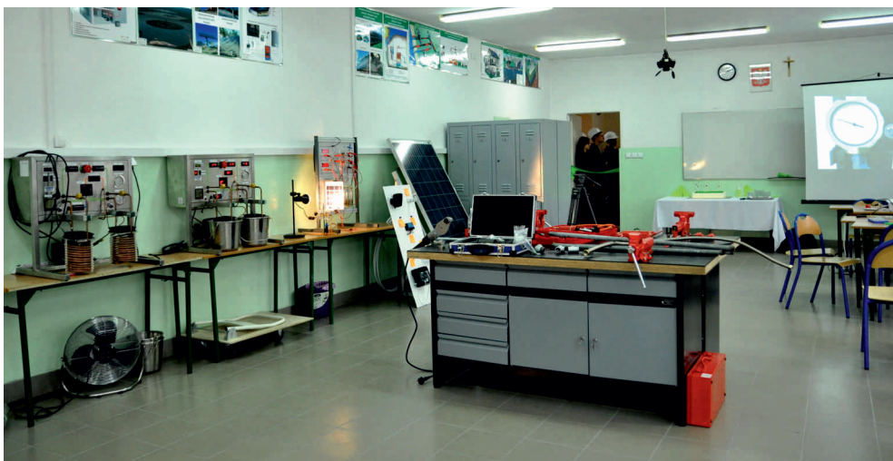
Nowoczesna pracownia odnawialnych źródeł energii